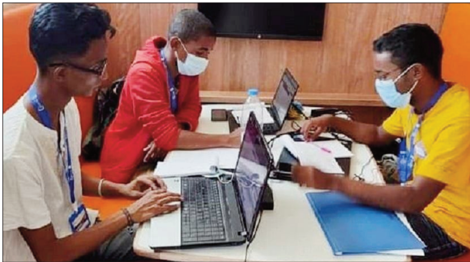
Ny sasany tamin'ireo mpifaninana tamin'ny Hackaton 2021.