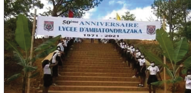
Lycée Ranohavimanana Norbert Ambatondrazaka mankalaza ny faha-50 taona nijoroany.

voka-panadinana arapanjakana ny Lycée Ranohavimanana Norbert Antsahamarova. Ahitana mpampianatra manana traikefa. Mampiavaka azy amin'ireo sekoly hafa, raha ny fantatra dia ny nahatafavoahany olombanona maro eto amin'ny firenena. Manana fitsipika hentitra amin'ny fanabeazana ny ankizy ao aminy. Feno 50 taona ankehitriny ny sekoly ary mitohy ny fanamarihana amin'ny alalan'ny hetsika samy hafa.