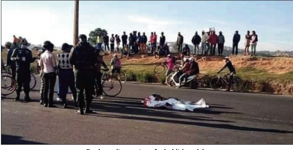
Ilay loza nitranga teny Ambohitrimanjaka.

Nisehoana loza mahatsiravina afak'omaly maraina, teny amin'ny lalan'Ambohitrimanjaka ao amin'ny distrikan'Ambohidratrimo. Fiara 4x4, na fiara tsy mataho-dalana iray, no nifandona tamin'ny bisikileta teny antoerana. Maty tsy tra-drano ilay mpitondra bisikileta, noho ny dona mafy sy ny ratra nahazo azy. Matetika no mandeha mafy ireo mpitondra fiara noho ny hatsaran'ny lalana vaovao eny Ambohitrimanjaka iny amin'izao fotoana, misy koa anefa ireo mpitondra kodiarandroa tsy misy motera mivady rehefa mandeha, izany dia anisan'ny mety