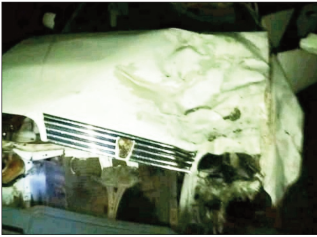
Mafy ny fifandonana teo amin'ity fiara ity sy ilay moto, nahatonga ny loza nisy fahafatesan'olona.

Olona miisa 3 no indray namoy ny ainy, io noy vokatry ny lozam-pifamoivoizana tamin'ny lalampirenena voalohany (RN1). Nisehoana lozam-pifamoivoizana namoizana ain'olona 03 izany lalampirenena izany, tao amin'ny Secteur Tsinjoarivo Iman-ga, distrikan'i Tsiroanomandidy, faritra Bongolava. Afak'omaly hariva no nitrangan'izany loza izany. Miaramila iray niaraka tamin'ny vady aman-janany nitaingina moto, no nifandona tamin'ny fiara noentina zandary