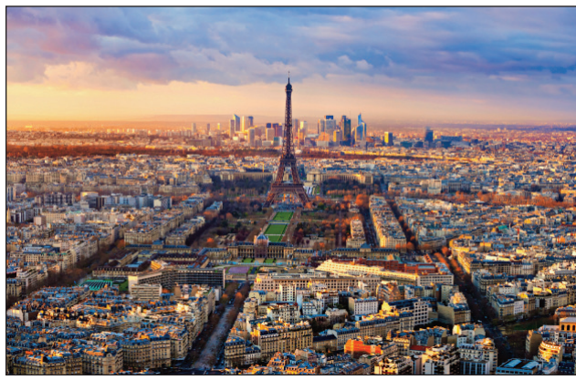
Paris, renivohitri'i Frantsa.

Toy ny ataon'ny antoko Tiako i Madagasikara (TIM), sy ny RMDM (Rodoben'ny Demokrasia eto Madagasikara) eto an-toerana, fantatra izao fa hamondrona ny heriny koa ireo Malagasy monina sy miasa any Frantsa mpomba ny filoha Marc Ravalomanana. Hamondrona ny heriny ireo ao amin'ny antoko sy vondrona politika miara-dia amin'i Dada any ivelany, toy izany koa ireo olon-tsootra resy lahatra amin'ny filoha nasionalin'ny antoko TIM sy ny RMDM. Nanao fanambarana izy ireo mahakasika izany: "izahay rehetra mpanohana ny filoha Marc Ravalomanana eto Frantsa, dia nanapa-kevitra ny hitambatra ato anatin'ny vondrona iray izay mitondra ny anarana hoe "Pro-Ravalomanana France". Hiara-hiasa am-pirahalalana sy hanao ny fomba rehetra ara-dalàna hitondra ny filoha Ravalomanana hatrany amin'ny fandresena amin'ny fifidianana Filoham-pirenena ho avy. Natao ity fampandrenesana ity, mba hampahafantarana ny zava-misy eto Frantsa ary manantena fiaraha-miasa avy amin'ny filoha Ravalomanana sy ny rehetra izahay". Izay mi-