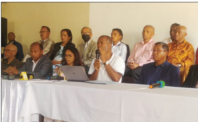
Ireo avy amin'ny HFKF nitafa tamin'ny mpanao gazety omaly.

Ny kristiana dia mitsipaka marindrano ny tolo-dalàna momba ny fampiatoana ny fitondrana vohoka, na « Interruption Thérapeutique de Grosesse » (ITG), izay kasaina hodinihina indray eny amin'ny Antenimierampirenena, ao anatin'izao fotoam-pivoriany ara-potoana izao. Mahitsy sy mazava ny namban'izy ireo tamin'ny alalan'ny HFKF (Hetsika Fampiraisana Kristiana ho an'ny Firenena), omaly teny amin'ny Le Pavé Antaninarenina, momba izany, fa tena tandindondondra ny firenena raha holaniana io tolo-dalàna io. Mifanohitra tanteraka amin'ny sitrapon'Andriamanitra izany. Andriamanitra no miasa, mamolavola ao ankibon'ny olona. Tsy eken'ny kristiana ny mamono olona satria Andriamanitra no tompon'ny aina. Ary na