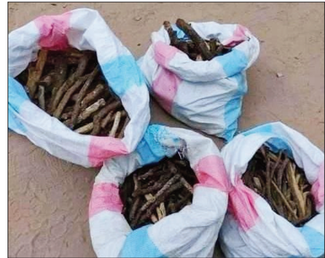
Ireo tangoarake tratra tany Ranopiso.