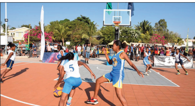
Basket 3x3 sy rugby Malagasy.