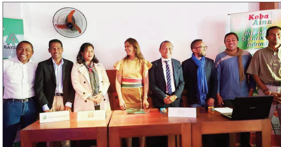
Ireo mpikarakara ny Aquathlon sy Triathlon Tamatave 2021.