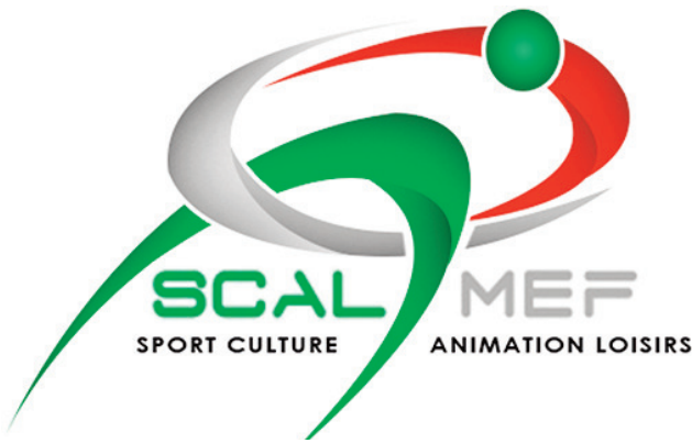
Ny sary famantaran'ny « ASCAL ».

Ny taona 2017 no nijoro ara-panjakana ny « Association Sportive Culturelle, Animation et Loisirs » eo anivon'ny Minisiteran'ny toe-karena sy ny fitantanam-bola (ASCAL). Ny « ASCAL », izay miezaka