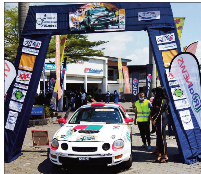
Rallye RIM andiany faha-42.