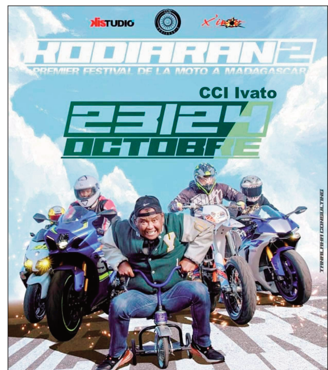
Premier festival de moto à Madagascar.