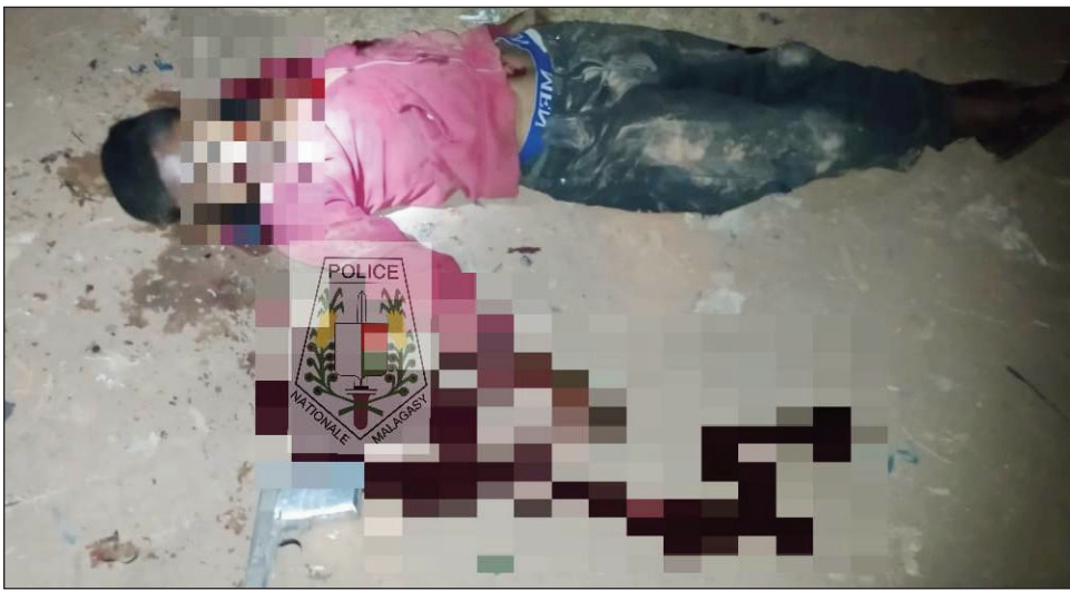
Ilay jiolahy lavo teny Avaradrano.

Nifampitana ny jiolahy sy ny polisy teny Manjaka Ilafy distrikan'Antananarivo Avaradrano, vokany: jiolahy iray no lavo nandritra ny fifandonana. Fanafihana mitam-piadiana voasakan'ny polisy, ny fanafihana saika nataona olon-dratsy, ka jiolahy iray no namoy ny ainy. Vao nahalala ny polisy, fa misy andian-jiolahy nikononona hanao fanafihana mitam-piadiana tao amin'ny tokantrano iray tany Manjaka Ilafy dia nidina haingana teny antoerana ireto mpitandro filaminana ireto. Fotoana fohy monja dia tonga ny polisy ary mbola hita teo ireo olon-dratsy. Nisy ny fifandonana nahery vaika, ka lavo tamin'izany ny jiolahy iray niaraka tamin'ny