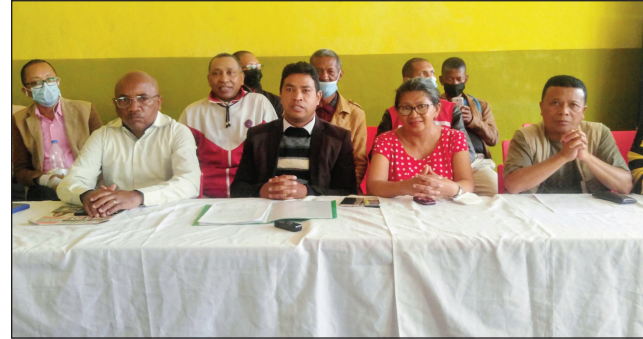
Ireo avy amin'ny sendika SSM.