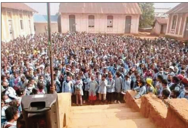
Ankizy marobe toy izao, no nahazo fantanana avy amin'ny polisim-pirenena tany Antsirabe.

Polisy misahana ny zaza tsy ampy taona, na ny Pmpm Antsirabe: mitety sekoly ny polisy any an-toerana ary manome torohay ho an' ireo ankizy manoloana ny fanararaotana sy ny fakam-panahy mety hahazo azy ireo eny anivon'ny fiaraha-monina. Nidina ifotony nitondra fantanana ho an' ireo mpianatra miisa 2435, tao amin'ny CEG Soamalaza Antsirabe faritra Vakinankaratra ny Polisy misahana ny zaza tsy ampy taona. Izany no natao dia ho fiarovana ireo ankizy, manoloana ny fanararaotana amin'ny endrika