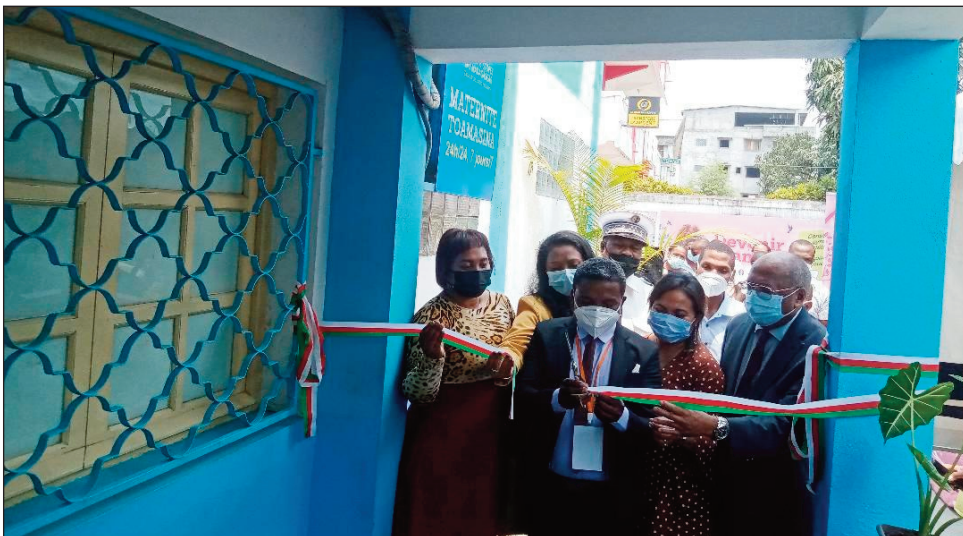
Ny fanokafana ny Marie Stopes tany Ankirihiry Toamasina.