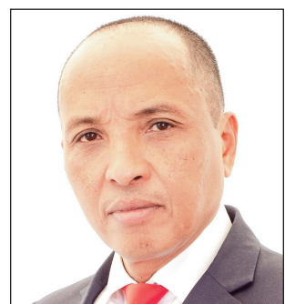
Ny depiote Fetra, avy amin'ny antoko TIM, ao amin'ny Boriboritany faha-5.