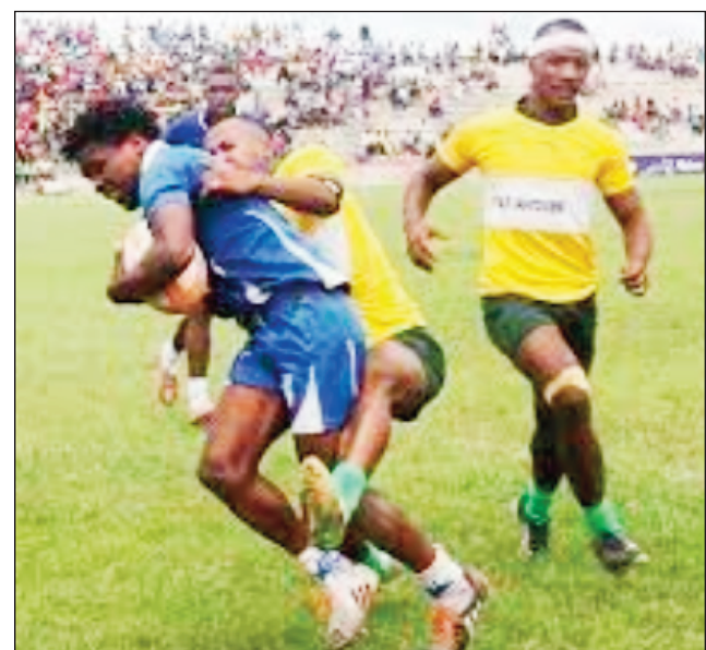
Rugby Elite Federal 2.