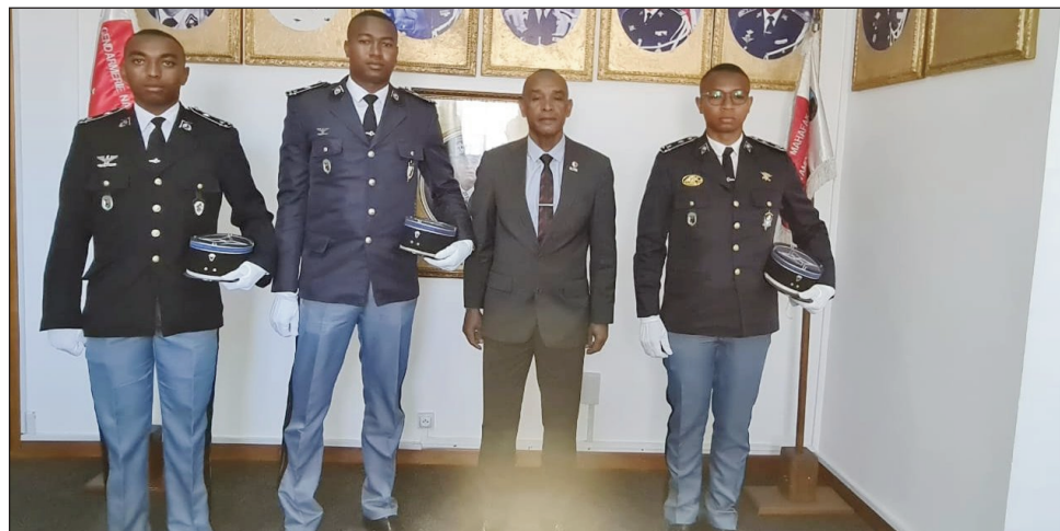
Ireo zandary 3 mirahalaha nahazo tso-drano tamin'ny SEG.