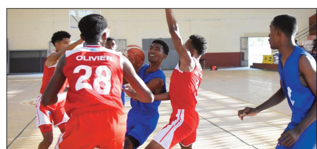
Fifaninanana basket 2021 any Mahajanga.

Mitohy any Mahajanga ankehitriny, ny fifaninanana basikety fiadiana ny ho tompondakan'i Madagasikara sokajy N1 B vehivavy sy sokajy U 20 zazalahy, izay efa nanomboka tamin'ny sabotsy 11 septambra 2021 lasa teo, ka hifarana amin'ny alahady 19 septambra ho avy izao. Voka-dalao azo tamin'ny andro faha-4 (talata 14 septambra 2021), natao tao amin'ny kianja "Complexe Sportif Mahajanga", sy tao amin'ny kianja ivelany amin'io toerana io. Sokajy N1 B vehivavy : Ffpro-Bctm vs Bcest