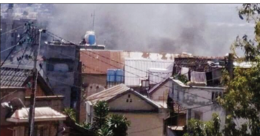
Ny fahamaizna nisy tetsy Ankaadifotsy.

Nisehoana haintrano mahatsiravina tetsy Ankadifotsy, ao amin'ny Boriboritany faha-3 eto Antananarivo Renivohitra omaly. Trano miisa 4 mifanakaiky no indray may nandritra izany. Niezaka namono ny afo ireo mpiray vodirindrina tamin'ireo niharam-boina, sy ny mpamonjy voinan'ny kaominina. Olona roa no voalaza fa tsy hita nandritra izao haintrano izao, izay mety namoy ny ainy noho ity loza izao. Mbola manao ny fanadihadina amin'ny antony nahatonga ny loza ny tompon'andraitrika.