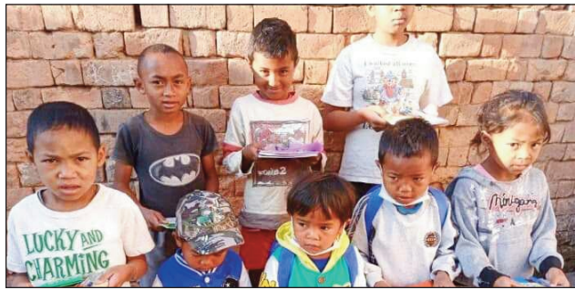
Ankizy mpianatra anisan'ny nahazo fitaovam-pianarana tany Ambohitrimanjaka.