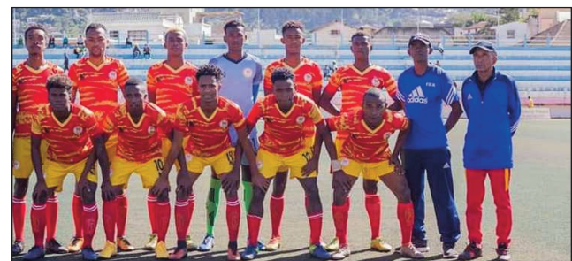
Ny ekipan'ny Dato Fc Atsimo Atsinanana 2021.