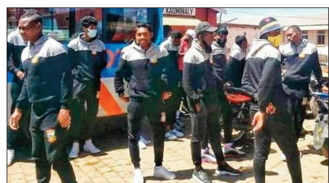
Ny ekipan'ny CFFA Madagasikara.

Afaka hiondrana ho any Lusaka Zambia ny ekipan'ny Cffa Madagasikara eo amin'ny baolina kitra, hifanandrina amin'ny ekipan'ny Kbwe Warriors Fc Zambiana, eo amin'ny lalao miverin'ny fifaninanana savaranonandon'ny fiadiana ny amboaran'ny CAF 2021 amin'ny alahady 19 septambra ho avy izao. Nahazo tapakila fiamanidina avy amin'ny fitondram-panjakana izy ireo raha ny fantatra afak'omaly, tetsy amin'ny ministeran'ny tanora sy ny