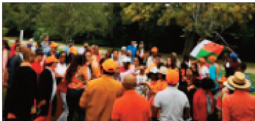
Diaspora fôpla, hoy ireo Malagasy monina any ivelany, miara-dia amin'ny mpanohitra aty Madagasikara na RMDM dispora.