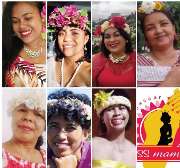
Izy 7 mirahavavy mifaninana amin'ny Miss Maman Mada 2021.

7 no mpandray anjara, mbola tsy misy sokajintaona, fa tafiditra ao daho. Ny fitsarana dia vote