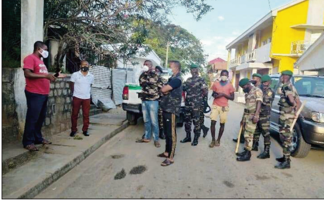
Ny fanakanana ireo mpino tsy hivavaka nataon'ny mpitandro filaminana tany Taolagnaro.

Nalahelo ny mpino tany Fort-Dauphin faritra Anôsy ny alahady teo, satria tsy navelan'ny mpitandro filaminana tany an-toerana niditra tao am-piangonana. Alahelo ny an'ireo mpino FJKM tany amin'ny renivohitry ny faritra Anôsy, fa tsy navelan'ny tompon'andraikitra tany an-toerana hanaovana fotoampivavahana ny fiangonana FJKM salema Vaovao, sy ny FJKM Betlehema Ampamakiambato, na dia vonona