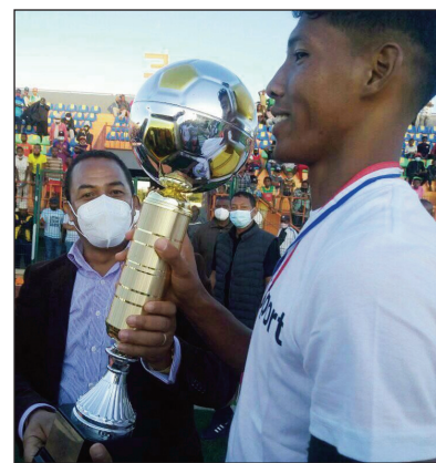
Ny kapitenin'ny CFFA nandray amboara teny amin'ny By Pass.