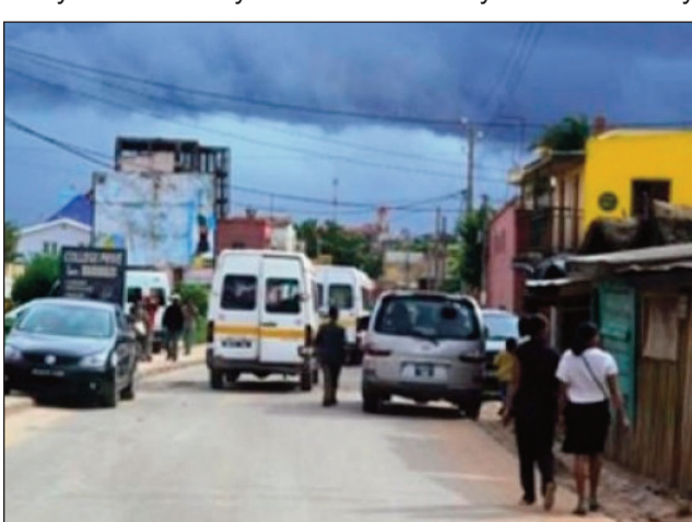
Tokony hiverina ho toy izao ihany ny lalana lavahan'ny Jirama eny amin'ny faritra Itsosy iny.

amin'ireny arabe na sisin-dalana ireny nandritry ny taona maro, amin'ny ankabony, dia indraindray tsy nahafapo ny mponina mpandoa hetra sy ny mpampiasa lalana. Hita soritra miavaka mandrakariva ny fanamboarana nataony, na dia misy aza ny ezaka famerenana azy amin'ny fandrakofana tara na simenitra. Ny tsy aritra kely ihany koa dia manohintohina ny fifamoivoizana ny asa ataony toy izao. Niseho izany tamin'ny fitohanana sy ny fihisan'ny fifamoivoizana teny amin'ny miakatra an'Ambonisoa mi-hazo an'Anosimasina sy Ampasika iny omaly. Misy fiantraikany any amin'ny fihariana sy ny asa amandraharam-bahoaka anefa izany toe-javatra izany.