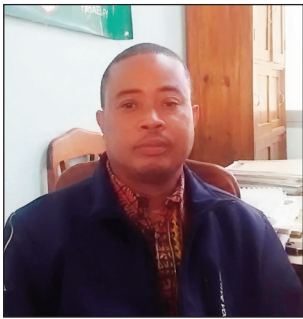
Ny filohan'ny FMNPM.