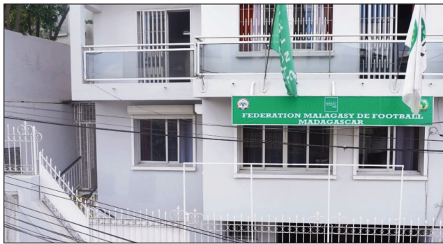
Ny foiben-toeran'ny FMF etsy Isoraka.