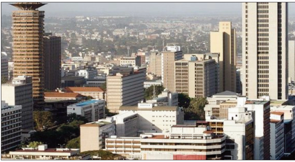
Nairobi renivohitr'i Kenya, ho ambohipihaonan'ny mpanabe vehivavy ato ho ato.

Tsy mahasakana ny asa efa natao nandritra ny 15 taona ny fisian'ny covid-19, asa izay sahanin'ny Forum for African Women Educationalists, izay atsy Nairobi Kenya ny foibeny, sady manana rahateo sampama eto Madagasikara, tsy miaramiasa ihany koa amin'ny Ministeran'ny Fanabeazam-pirenena. Misongadina ny fanabeazana ny ankizy vavy mba hahatoky tena, eo koa ny famporisihana azy ireo ho tia ny taranja toy ny Matematika, tsy atao ambanin-javatra koa anefa ny fampihenana ny fitsoahana andaharana an-tsekoly eo amin'ny ankizy vavy ihany. Fantatra fa misy ny fifaninanana nampanaovina ny mpampianatra, ka hamaliana ny fanontaniana manao hoe : "Tantarana ny tetik'asa