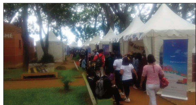
Ny Tsenaben'ny Fizahantany, tetsy amin'ny zaridaina Antaninarenina.

Nifarana omaly tetsy amin'ny zaridaina Antaninarenina ny Tsenaben'ny Fizahantany andiany faha-2, rehefa naharitra hateloana, izay nokarakarain'ny ONTM, na ny Ofisim-pirenena momba ny Fizahantany eto Madagasikara. Fampiroboroboana ny fizahantany anatin'ny eto amintsika ny tanjona tamin'izao hetsika izao, ho fanetsehana indray koa ireo mpanandraharaha eo amin'ity sehatra ity, satria tena voa mafy izy ireo hatramin'izao, noho ny valanaretina coronavirus, mbola mikatona ny sisintanin'i Madagasikara. Noho izay antony izay vitsy, na azo lazaina tsy misy mihitsy ireo mpizahatany vahiny tonga eto amintsika. Niantraika mafy tamin'ity sehatra ara-toekarena ity izany, mahatratra hatramin'ny 80% amin'izao fotoana ny trano fandraisam-bahiny mikatona manerana ny Nosy, izany hoe trano fandraisam-bahiny 4 amin'ny 5 no nikatona vokatry ny valanaretina. Anisan'ny nikarakarana ny hetsika natao tamin'ity herinandro ity, ho fampivoarana ny fizahantany anatin'ny, satria hatramin'izao mbola tsy misy fanantenana ny mahakasika ny fizahantany avy any ivelany.