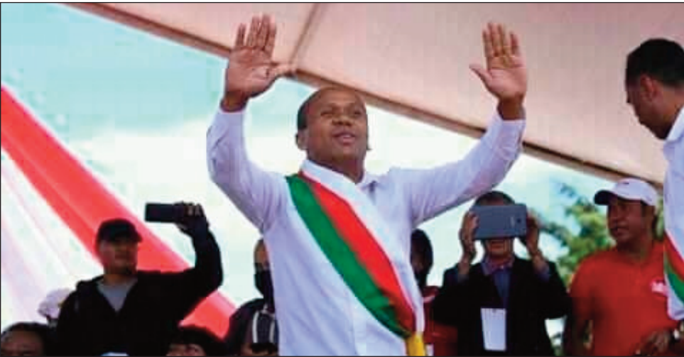
Ny depiote TIM Todisoa voafidy tao amin'ny Boriborintany faha-6.