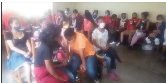
Ny fivoriana nataon'ireo vehivavy manana fahasembanana eto Madagasikara.