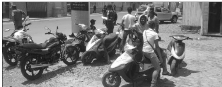
Ny fisavana moto nataon'ny polisy omany.