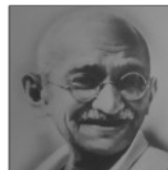
Ny olo-malaza Indianina, Mahatma Gandhi.