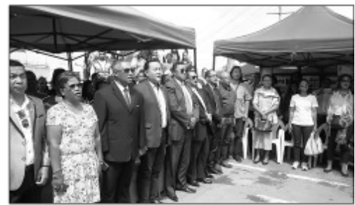
Ny fanokafana ny varavarana misokatra teny Ambohimananina.

Nanomboka omaly ary hitohy anio ny varavarana misokatra, karakarain'ny tompon'andraikitra ao amin'ny boriboritany faha 6, kaominina Antananarivo Renivohitra (CUA), hampahafantarana ny zavamisy sy ny fomba fiasa ao an-toerana. Ankoatra ny fampirantiana ny fomba fiasa eo anivon'ny boriboritany dia misy ihany koa ny varotra fampirantiana atao'ireo fikambanana maro samihafa toy ny sembana izay naneho ny hafaliany satria nomen'ny tompon'andraikitra eo anivon'ny boriboritany hafa izy ireo, na ao anatin'ny fahasembanana aza, nahafahany nampirantany na taozavatra atao'izy ireo. Nisy ny fangatahana nataony, izay avy hatrany dia novaliana fa maimaimpoan avokoa ny fikarakaran'ny sembana ireo taratasy eo anivon'ny boriboritany. Ankoatra izany teo ireo mpiara-miombon'antoka maro toy ny mpamony voina, ny orin'asa maro mpanohana ny hetsika. Tsy adino ihany koa fa nisy ny fanomezan-drà maimaimpoana tao an-toerana, satria