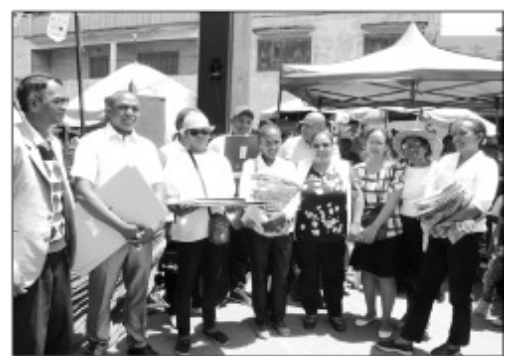
Solontenan'ny fokontany, anisa n'ny nahazo loka tamin'ny fifaninana Fokontany Madio.

Ny volana mey 2019 lasa teo no nanomana ilay fifaninana atao hoe « Fokontany Madio » ny teo anivon'ny Tanànan'Antananarivo Renivohitra (CUA), izay niarahana tamin'ny Fokontany miisa 14 ao amin'ny boriboritany voalohany sy faha efatra. Ny CARE International, miara-miasa amin'ny tetik'asa PIAA : Programme Intégré d'Assainissement d'Antananarivo, izay eo ambanin'ny fiahian'ny MAHTP, na ny Ministère de l'Aménagement du Territoire de l'habitat et des Travaux Public, vatsin'ny AFD na ny Agence Française de Développement vola, no nanohana tamin'ny fanaovana izao fifaninana izao. Notanterahina teny Anosibe Ouest voalohany ny fizarana ireo mari-pankasitrahana ho an'ireo mendrika tamin'ireo Fokontany 14, izay marihina fa ireo Fokontany ireo no manamorona ny lakan-dranon'Andriatany, tafiditra ao anatin'ny tetik'asa, ka toy izao izany : -ny voalohany dia ny Fokontany Ampeloha Cité, -ny faharoa dia ny Fokon-