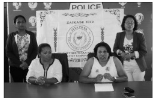
Ireo anisan'ny mpitarika ny FIVAPOVA.