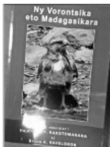
Ilay boky, Ny vorontsika eto Madagasikara.