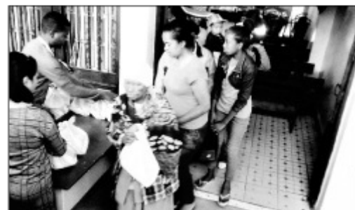
Ny fizarana fanomezana ireo avy amin'ny Vondrom-bavaka ao amin'ny Boriboritany faha-5, nataon'ny CUA.

Mitohy hatrany ny asa sosialy tanterahin'ny fiadidina ny tanànan'Antananarivo Renivohitra (CUA). Nozaraina vary 3 kiloa isan'olona ary menaka 1 litatra ireo vehivavy mpi-anatra soratra masina, amin'ny Vondrom-bavaka ao amin'ny boriboritany fahadimy, izay samy nahitana solontena avy, amin'ireo fokontany 27 ny faran'ny herinandro teo. Izao no natao dia mba hitsinjovana ny maha-olona ireo vahoaka sahirana mianatra soratra masina, na vondrom-bavaka isaky ny