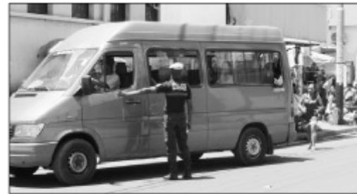
Ny fandrindrana fifamoivoizana ataon'ny polisy nasionaly sy polisy monisipaly.

Nandray andraikitra goavana amin'ny alalan'ny fanaovana hetsika manokana ampi-rindrana ny fifamoivoizana ny Kaominina Antananarivo Renivohitra (CUA) nanomboka ny andron'ny alatsinainy teo, ka hatramin'ny rahampitso zoma. Ny antony dia ny mba hitsinjovana ireo mpanala fanadinana-parjakana Bakalorea tsy ho tara amin'ny fitohanana ny fifamoivoizana, ka ho afaka hanatanteraka tsara sy hahavita izany fanadinana izany am-pitoniana. Anisan'ny mitarika fitohanana ny fifamoivoizana eto an-dRenivohitra ireo taxi-be tsy manaja ireo toerana izay efa natokana ijanonany, eo ihany koa ireo mpandeha an-tongotra izay milatsaka any anaty arabe, ka izay indrindra no antony nametrahana ireo Polisy Monisipaly eny