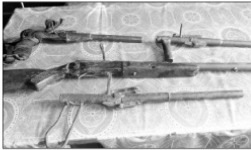
Ireo basy vita gasy naterina tamin'ny mpitandro filaminana.