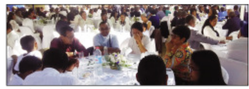
Ireo mpiasa sy mpiara-miombon'antoka amin'ny Salfa teny Andohalo.