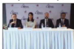
Ireo tompon'andraikitra ao amin'ny banky BMOI sy BCP.