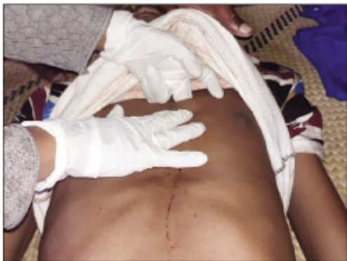
Ilay lehilahy nisy namono tany Sambava ny 6 oktobra lasa teo.

Nomen'ny fitsarana fahafahana vonjy maika ilay voarohirohy nanindrona antsy tovolahy iray va 22 taona, maty tamin'ny alahady 06 oktobra 2019 lasa teo tany Ambodisatrana, Sambava. Nisararam-panambadiana izy sy ny vadiny kanefa mbola samy tsy nifankafofy. Ny olona, ny fianakavian'ny lahy dia tsy nankasitraka ny fiarahan'izy ireo intsony noho ny antony maro samihafa. Nanomboka teo dia nitombo hatrany ny disadisa sy ny tsy fifampitokisana intsony tamin'izy roa mivady ireo. Tamin'ny 10ora alina tamin'io alahady 06 oktobra 2019 io dia nisy niantso ilay tovolahy. Tsy sahy nilaza mivantana tamin'ny fianakaviany anefa ity farany fa ny vadiny teo aloha ihany io niantso azy io. Andeha hamonjy lanonana miaraka no niantsoan'io vadiny io azy. Tamin'ny 4ora maraina ny