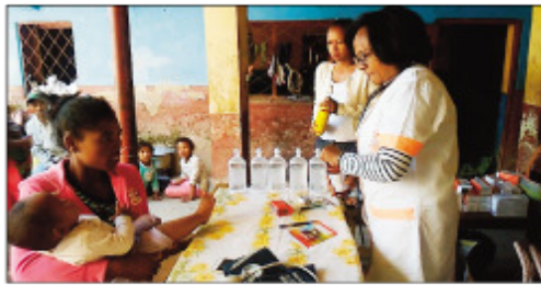
Ny fitsaboana sy fizarana fanafody maimaimpoana nataon'ny CUA teny Mandrangobato.

Ny sabotsy teo to-kony ho tamin'ny 1 ora maraina teo dia nitrangana haintrano teny amin'ny faritra Anosibe, Fokontany Mandrangobato faha-2. Raha ny fantatra dia ireo trano hazo teny amin'ny manodidina no lasibatra tamin'izany, mbola tsy fantatra mazava ny fototry ny afo hatreto. Raha ny antontan' isa voarary tamin'ny Fokontany sy ny Equipe locale de Soutien ( ELS) eny an-toerana dia trano miisa 32, misy fianakaviana 37 ary olona 167 no niharam-boina tamin'izany. Raha ny omaly alatsinainy dia tonga teny antoerana ny teo anivon'ny Boriboritany faha-4, kao-