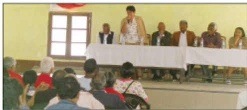
Ny filhaonan'ireo senateran'i Madagasikara tamin'ireo solontenan'ny mponina Ambohitrimanjaka.