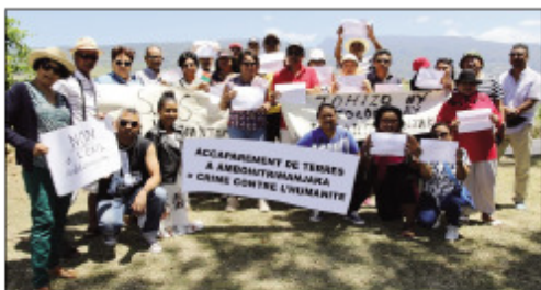
Ny sasany amin'ireo Malagasy monina atsy amin'ny Nosy La Réunion, manohana ny mponin'Ambohitrimanjaka.

« Atsaharo tsy misy hata'andro ny fanotofana tany ao Ambohitrimanjaka ! Atsaharo ny asa fanombohana sy ny fananganana ny Tanamasoandro eo Ambohitrimanjaka ! Atsaharo ny fandatsahan-drà ny vahoaka sy ny fampiharana herisetra ! Aza esorina amin'ny Tanindrazany ny mponina ao Ambohitrimanjaka. Aza atao sesitany ny mpiray Tanindrazana satria tsy nisy heloka vitany. Midadasika i Madagasikara, ka maro ny toeran-kafa tsy misy mponina, azo hanorenana Tanamasoandro ». Ireo no hafatra nampitain'ny mpiray Tanindrazana Malagasy monina any amin'ny Nosy La Réunion, nandritra ny fihonana fanohanana ny tolon'ny vahoakan'Ambohitrimanjaka, notontosaina ny alahady teo. Maneho firaisam-po sy firaisantsaina ho an'ny mponin' Ambohitrimanjaka ireto olon-tsotra sy solontenam-pikambanana maro any La Réunion ireto sady