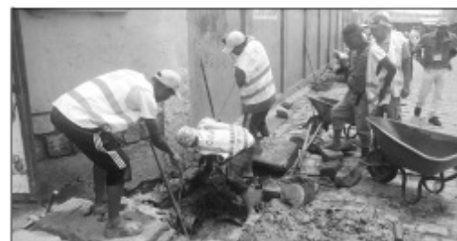
Ny fanadiovana tatatra teny Soavimasoandro nataon'ny CUA.

Nohon'ny fitarainan'ny mponina teny Soavimasoandro dia nidina nisikotra tatatra nanomboka afak'omaly ny ekipan'ny boriboritany fahadimy Kaominina Antananarivo Renivohitra (CUA). Araka ny hita teny an-toerana dia tsentsin'ny fako ny tatatra ka mivoaka ety ivelany ny rano maloto, voka-ny : simba koa ireo tatarano ary mikorontana sy miala ireo pavé, natao aloha ny fanalana fako anaty bizo ary hambaorana ireo tatarano simba ary hambaorana ny pavé ary mety ho herinandro eo ho