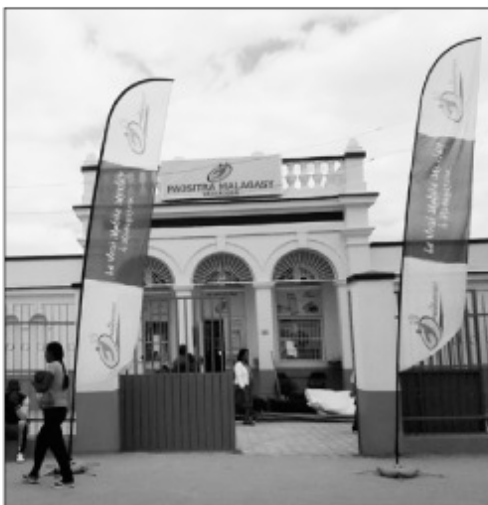
Biraon'ny Paositra vao notokanana.

Nosokafana tamin'ny fomba ofisialy omanaly tetsy Vasakaosy Boriboritany I, ny biraon'ny Paositra vaovao faha 255 eto Madagasikara. Fitokanana birao izay ao anatin'ny fanamarihana ny andro maneran-tany ho an'ny Paositra, izay-tanterahina isaky ny 09 Oktobra. Voasoritra ao anatin'ny fitokanana foto-drafit'asa ity ihany koa ny fankalazana ny faha 145 taonan'ny fiombonamben'ny Paositra maneran-tany sy ny faha 25 taona niantsoana ny anarana Paositra Malagasy teto Madagasikara. Manantanteraka hetsika fampirantina ny tantaran'ny hafia ny Paositra Malagasy, izay atao etsy amin'ny Zaridaina Antaninarenina nanomboka ny Talata lasa teo ny Paositra Malagasy. Hita ao anatin'ny hetsika fampirantina ireo vakoka hajan'ny Paositra nivoaka nanomboka ny andron'ny fanjanahantany ka hatramin'izao, izay mirov ny tantaram-pirenena sy ny