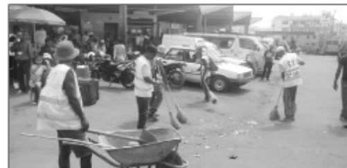
Ny fanadiovana nataon'ny CUA teny Ampasampito.

Nisy ny fanadiovana ny fiantsonan'ny zotra nasionaly sy rezoan'ny Ampasampito Boriboritany faha-5, Kaominina Antananarivo Renivohitra (CUA), izay nataon'ny sampana teknika sy ny mpanadio tanàna ao anivon'ity Boriboritany ity. Natao tamin'izany ny famafana ny sisin'ny arabe sy ny fiantsonan'ny fiarakodia, ny fanapahana bozaka ny marina, ary ny tolakandro dia ny fanadiovan'ny pompier tamin'ny alalan'ny rano, ary nofaranana tamin'ny famendra-