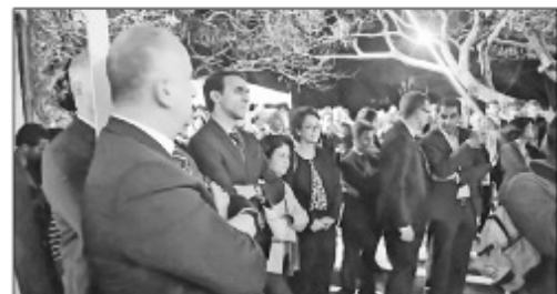
Fihonana teo amin'ny iraka avy amin'ny MEDEF sy ireo mpandraharaha tompona orinasa Malagasy, teny amin'ny tranon'ny Masoivoaho Frantsay teny Ivandry.