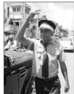
Polisy Monisipaly mandrindra ny fifamoivoizana eto an-drenivohitra.