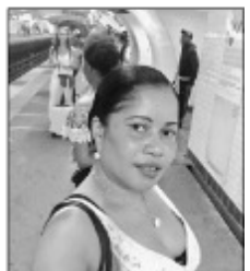
Rivera, mpanakanto Malagasy atsy amin'ny Nosy Mayotte.