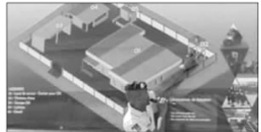
Ny kisarin'ny tranon'ny BRS hapetraka any Miandrivazo.