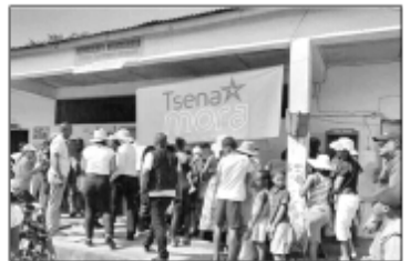
Daholo NA Hanao sefon' ny GABONE.

Joinesse Nirina : shuuuuuu, na hanao Vary Mora Izany na Hamboetra Directe, tsy olana tsony , tsiefa zay tiary ve no Atao eee, Aza mody mitapy manao sarit-sarim- pifidianana, fa efa FantaTRA fa ny Tsy Ampy SOLAITRA no miakatra daholo mahazo toerana ao Fitondrana, Apiakaro