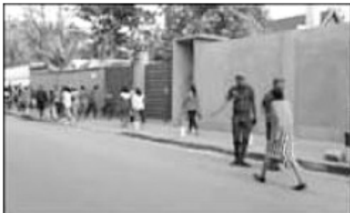
Ny fanentanana nataon'ny polisim-pirenena ny herinandro teo.