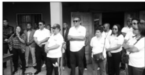
Ny Komity Mpanohana an'i Penjy eny Ivato.