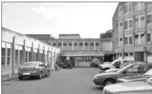
Ny Hopitaly HJRA Ampefiloha.