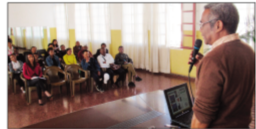
Ireo mpiandraikitra ny fitantana ny loza voajanahary eny anivon'ny fokontany miisa 44, ao amin'ny Boriboritany I.