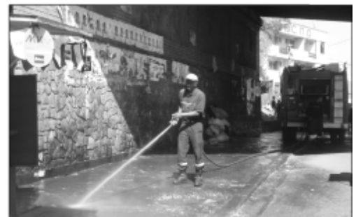
Ny fanadiovana nataon'ny Boriboritany faha-3.