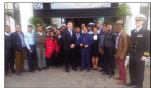
Ireo mpanjara anjara tamin'ny atrikasa momba ny fampandriana fahalemana an-dranomasina.