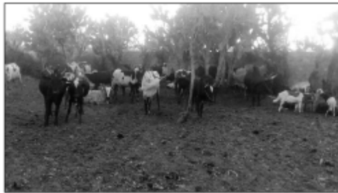
Ombly tafaverina noho ny ezaky ny mpitandro filaminana sy ny mpanara-dia.