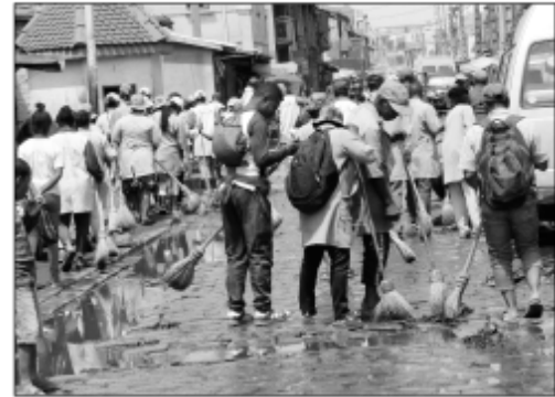
Ny fanadiovana tao amin'ny Boriboritany voalohany.

"A"ntananarivo soa iombonan'ny Magagasy, ezahina hatrany ny manadio ireo fokontany rehetra izay mandrafitra ny Boriboritany enina eto an-dRenivohitra, araka ny lamin'asa izay efa napetraky ny Ben'ny Tananan'Antananarivo Renivohitra (CUA), Lalao Ravalomanana. Araka izany dia novitaina afak'omaly ny fanadiovana ny arabe "Ny Havana Ramanantoanina" eny Andavavamba, izay niarahan'ireo ekipa teknika Boriboritany Voalohany nifandrimbonana. Nanomboka teny amin'ny FJKM Kristy Velona Andavavamba izany, nihazo teny Manarintsoa, Anatiahaazo Isotry, Andranomanalina ary nifarana manoloana ny BMH Isotry. Nirefy 1 kilometra sy 600 m ity lalana izay nodiovina ity ary hita tamin'izany fa mbola mila hamafisina hatrany ny fanentanana ireo mponina amin'ny fanadiovana, satria raha araka ny nambaran'ny Tompon'andraikitra avy eo anivon'ny Boriboritany Voalohany dia mbola miandry hatrany ny Kaominina ny mponina vao manadio, eny fa na dia izy ireo ihany aza no mpandoto. Efa misy ihany