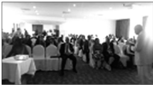
Ireo mpisehatra amin'ny fampivoarana ny zaza manana fahasembanana tetsy amin'ny Hotel Carlton ny Alarobia teo.