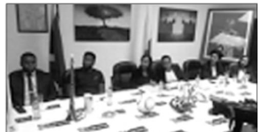
Ny Masoivoho Afrikanina Tatsimo niaraka amin'ireo mpiara miisa aminy amin'ny hetsika « Nelson Mandela Cup ».