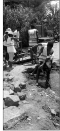
Ny fanadiovana lakandrano teny amin'ny Boriborintany faha-6.