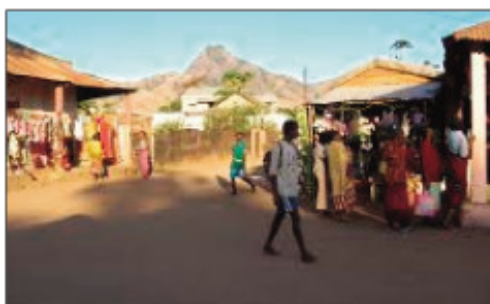
Ny tanànan'i Befandriana Avaratra, tsy mandry fahalemana koa.

Nodimandry omaly alarobia tamin'ny 12 ora 30 tao amin'ny Hopitaly Soavinandriana Antananarivo ny Zandary prinsipaly kilasy ambony, Komandin'ny Tobim-paritry ny Zandarimariam-pirenena tao Befandriana-avaratra (Commandant de Brigade). Natao ny ezaka rehetra nanavotana ny ain'ilay maherifo izay voatery notsaboina taty Antananarivo nohon'ny ratra nanjo azy, nandritra ilay fanafianjolahy nitranga tao Befandriana Avaratra ny alin'ny 29 Jolay lasa teo nefa tsy tana ny ainy.