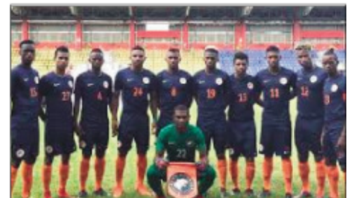
Ny ekipan'ny Fosa Junior Madagasikara.