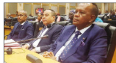
Ny filohan'ny Antenimierandoholona Malagasy, niatrika fivoriana tatsy Afrika Atsimo.