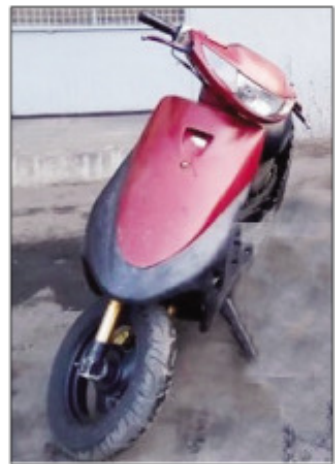
Ilay moto mena nisy nangalatra fa azon'ny polisy.

Noho ny hetsika izay nataon'ny polisy teny amin'ny faritra Andohatapenaka iny, moto nisy nangalatra miisa 3 no azon'izy ireo tamin'izany. Noho izay antony izay, langavian'ny polisy izay tompo-na moto jog miloko mena mba hanatona eny amin'ny kaomisaria ny boriboritany fahafito haka ny moto-ny. Nandritra ny « opération coup d'arrêt » nataon'ny polisy teny amin'ny faritra Andohatapenaka ny 28 jolay teo no nahitana olona nanosika ity moto mena ity, ka vao nahita ny polisy nanao fisafoana teny amin'ny faritra iny ilay mpangalatra dia nirifatra nitsoaka avy hatrany. Miisa 03 ny moto halatra azon'ny Polisy tamin'io fotoana io ary efa tonga teny amin'ny Polisy avokoa ny tompon'ireo moto anankiroa, fa ilay moto miloko mena sisa no mbola iandrasana ny tompo, ka anaovan'ny mpitandro filaminana izao filazana izao.