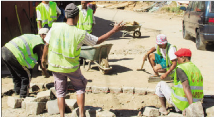
Ny fanamboaran-dalana ao amin'ny Boriboritany faha-5.

E o am-pamaranana ny asa fanamboarana ny arabe atao rarivato na pavé eny Tsarahonenana ny ao anivon'ny Boriboritany fahadimy, Kaominina Antananarivo Renivohitra (CUA) ankehitriny. Ampahan-dalana izay nampikaikaika ireo mpoina mifamezivezy eo efa nandritra ny fotoana maharitra, no namboarin'ny Kaominina Antananarivo Renivohitra amin'izao fotoana. Ireo ekipa teknika avy eo anivon'ny boriboritany fahadimy no miara-misalahy manamboatra ity lalana ity. Entanina hatrany isika mponina araka izany mba hikajy ireny fanâ-