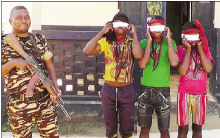
Ireo 3 lahy nikasa haka olona an-keriny, saron'ny zandary.

Tsy amin'ny tanàn-dehibe ihany no misy ny fakana olona an-keriny, na kidnapping fa amin'ny faritra ambanivohitra koa. Tany Betroka, faritra Anôsy, nisy ny fikasana haka an-keriny, 3 lahy no voasambotry ny Zandary tamin'izany. Nikasa haka an-keriny ny filohan'ny Fokontanan'i Maroraza, Kaominina Tsaraitso, Distrikan'i Betroka izy ireo ny herinandro teo. Tsikaritra ny Fokolonona tao an-toerana ny fihetsik'ireto olon-dratsy ireto toa hafahafa, ka niroso tamin'ny fisamboran'azy telo avy hatrany ny mpiray dinan'i Mangoky sy ny Zandary ao Betroka. Mbola tanora erotrerony avokoa izy telo lahy, ary anisan'ireo jiolahy ikoizana any amin'ny Distrikan'i Betroka