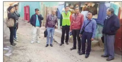
Ireo tompon'andraikitra ao amin'ny Boriboritany faha-6, nijery ny hanatanterahana ny fanamboaran-dalana.