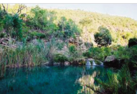
Ny reniranon'i Onilahy mandalo ny tanànan'i Benenitra.

Ny tanànan'i Benenitra any amin'ny faritra Atsimo Andrefana indray no Mahavariana sy Mahaliana eto amin'ny gazetinao androany. Renivohitra ny distrikan'i Benenitra ity kaominina ity, kaominina an-drenivohitra. Somary iva toerana ihany izy satria 240 m ny haavony miohatra amin'ny ranomasina. Lalovan'ny reniranon'i Onilahy ity tanàna ity. Vokatra any ny vary sy ny haninkotrana isan-karazany. Mpiomby omby sy ondry ary osy koa ny mponina any.