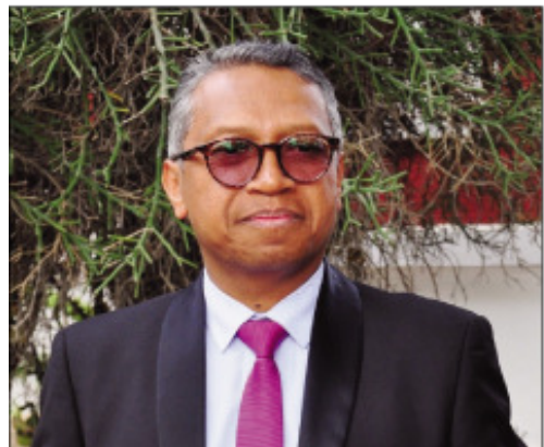
Ny tale jeneralin'ny Bianco vaovao.