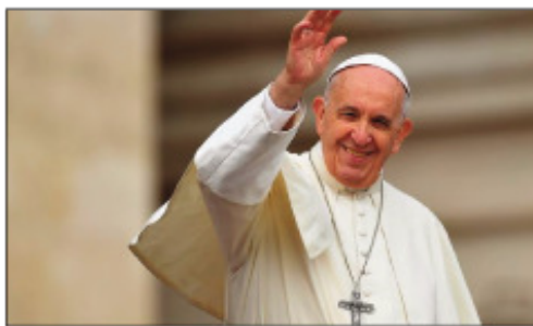
Papa François, filohan'ny Eglizy Katolika eran-tany.