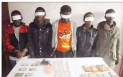
Ireo jiolahy mpaka an-keriny tratra.

T ratra avokoa ankehitriny ireo jiolahy miisa 5 mpaka ankeriny tao amin'ny Faritra Alaotra-Mangoro iny. Raha tsiahivina dia ny harivan'ny alahady 16 jona 2019 lasa teo tamin'ny 7 ora dia nisy zazalahikely 12 taona mipetraka ao Betela kaominina Morarano-krakma Distrikan'Amparafavola izay nalaina ankeriny, nataon'ireo jiolahy miisa 02 mitam-basy. Tsy niandry ela ny zandarimaria tany an-toerana dia nikaroka vao-vaio avy hatrany mikasika izany. Ny alarobia 19 jona 2019 anefa dia navotsit'ireo tsy mataho-tody ihany izay zaza tao amin'ny toerana anelanelan'i Ambavasambo any Anosivolakely Distrikan'Anjozorobe rehefa nandoa vola 46 tapitrisa ariary ny fianakaviana