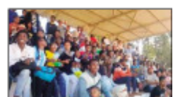
Ireo mpijery nanatrika ny fanokafana.

tanjahantena ifaninana dia ny baolina kitra sy Basket-ball izay tantaranana mandritra ny iray volana. Efa nisy sahadany ny voka-dalao ny faharan'ny herinandro teo tamin'ity fiainanana amboara Rofia ity: Baolina kitra lehilahy: -EMIT 2-1FLSH, -PAT 0-2 ENS, -FAC MED 2(2)-2(4)ISTE Baolina kitra vehivavy: -FAC SC 0(2)-0(3)ENS -FLSH 1-0 ISTE