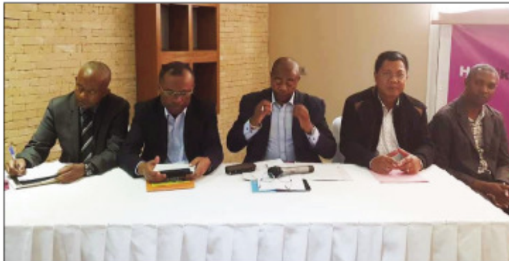
Ny fivoriana notarihan'ny hetsiky ny olom-pirenena miady amin'ny hosoka sy ny hala-bato tany Toamasina.