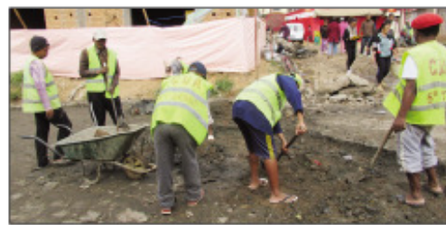
Ny asa fanamboaran-dalana ataon'ny Boriboritany faha-5 eny Tsarahonenana.

Mitohy hatrany ny asa fanamboarana lalana tanterahin'ny fiadidiana ny Kaominiana Antanarivo Renivohitra (CUA). Nanatanteraka izany ny avy eo anivon'ny boriboritany fahadimy teny amin'ny farit'i Tsarahonenana, lalana ifamezivezen'ny mponina sy fiara isan-karazany no amboarina ho vita «pavé» na rari-vato. Simba tanteraka ny eo amin'ity faritra amboarina ity ary manahirana ireo rehetra mpampiasa izany lalana izany. Izaon