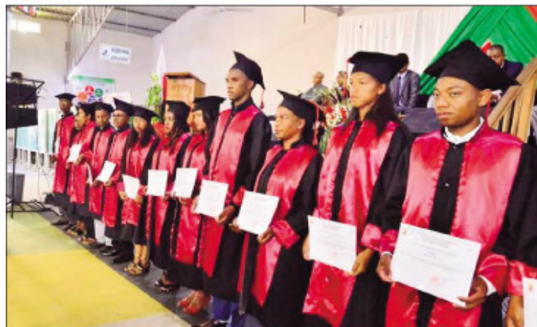
Ny sasany amin'ireo mpianatra nahavita fiofanana tao amin'ny ENS Fianarantsoa.

Fanehoan-kevitra sms : 034 09 187 88 ; 032 11 505 44 ; 033 24 783 65