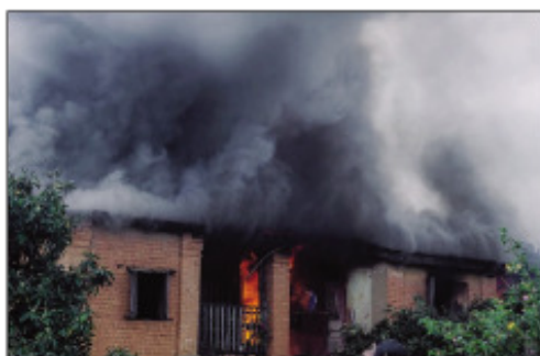
Ilay trano may tany Manolotrony Ambositra.