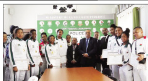
Ireo mpilalao basket-ball vehivavy nahazo medaly volamena taty Maurice farany teo.