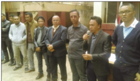
Ireo nitarika ny fivoriamben'ny antoko TIM teny amin'ny Boriborintany faha-6.

Vita ny alahady teo ny Fivoriamben'ny antoko Tiako i Madagasikara (TIM), ao amin'ny Boriborintany faha-6, nanaovana ny tatitra ny kongresin'ny antoko farany teo, ho an'ireo tsy afaka namonjy izany. Voaresaka tamin'izany koa ny fiomanana amin'ny he-tsika sosialy izay hataon'ny antoko ny 17 aogositra ho avy izao. Fotoana koa nanehoan'ny mpitarika Fokotim sy ny solontenan'ny fototra, na ny base ny