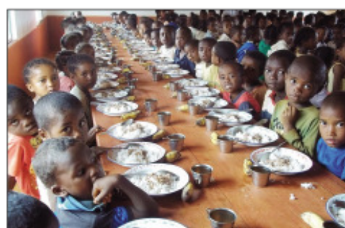
Mpianatra any Atsimon'ny Nosy, nahazo fampisakafoana an-tsekoly avy amin'ny PAM.

Ady amin'ny tsy fanjarian-tsakafo amin'ny mpianatra ambaratonga voalohany eto amintsika, ny Fandaharan'asa Erantany momba ny Sakafo, na PAM no dia manohana ny fandaharan'asa fampisakafoana an-tsekoly na cantine scolaire. Mahatratra 786 ireo EPP amin'ny faritra telo any atsimon'ny Nosy no misitraka ity fandaharan'asa ity, izay ahitana mpianatra miisa 1 938 365, araka ny tombana natao ny taona 2018. Sakafo be otrikaina, vitamina, hery fiarovana, hery hoenti-miasa, no anisan'ny entin'ny sakafo an-tsekoly omen'ny PAM amin'ny ambaratonga voalohany any atsimon'i