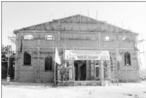
Ny FJKM Antsahamaina.

Nisongadina nandritry ny fetin'ny taranaka ny Alahady 25 Aogositra lasa teo fa mbola ezaka goavana no miandry ny mpino kristiana sy ny zanaka am-pielezana amin'ny famitana ny tafon-trano sy ny tilikambon'ny Fjkm Antsahamaina Famojena, synodam-paritany Antananarivo atsianana. Nifanome tanana ireo zanaka am-pielezana sy ny renifiangonana tamin'ny alàlan'ny rakitra isan-taranaka narahana tonombola sy lavantim-bokatra. Tanjona amin'izany ny ezaka famitana ireo asa mbola miandry ny fiangonana. Raha tsiahivina dia ny volana Aprily 2017 no napetraka ny vato fototry ny fiangonana izay natrehin'ny folbe Fjkm sy ny synodam-paritany. Roa tao-