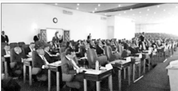
Nolavin'ny Loholona ny fandanihana an'ity tolo-dalàna mifehy ny Mpanohitra ny Zoma teo.