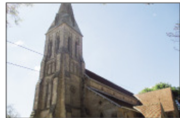
Ny FJKM Tranovato Rasalama Maritiora Ambohipotsy.

Hanatanteraka ny fandraisan-tanana ny mpitandrina RAMANANTSOA Andriami- haja Tiana Dani mianakavy, ny avy ao amin'ny fitandremana FJKM tranovato Rasalama Maritiora Ambohipotsy. Toy izao ny fandaharam-potoana tsara ho fantatra amin'izany : ny Talata 3 Septambra 2019 izao no fotoana hiarahana amin'ny Foibe FJKM sy ny Synodamparitany Antananarivo Atsimo, ary ny Alahady 8 Septambra 2019 kosa no hiarahana amin'ny fitandre- mana sy ny taranany ampielezana. Ny fo- toana rehetra dia samy manomboka amin'ny 9 ora sy sasany maraina avokoa . Ny tenin'Andriamanitra ho banjinina mandritra izany dia izay voasoratra ao amin'ny Filipiana 1 :27b manao hoe : « miray fo hiara-miezaka hampandroso ny finoana . RaMahery