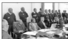
Ny fikaonan-doha nataon'ireo ao amin'ny ministeran'ny filaminam-bahoaka.

nahitana ireo tale sy lehibena sampan-draharaha isan-tsokajiny eo anivon'ny Minisitera. Fikaonan-doha amin'ny lafiny fandiampaha-halemana mifandraika indrindra amin'izany fahatongavan'ny Papa izany. Arakany vaovao nampitain'ny seraseran'izy ireo, ho avy ny fiantsoana ireo mpanao gazety iresahana ny fepetra mahakasika iza-