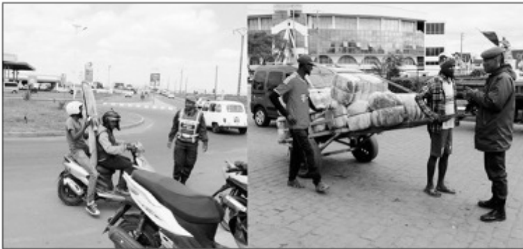
Fanentanana momba ny lalànan'ny fifamoivoizana ataon'ny polisim-pirenena.

Mitohy hatrany ny hetsika fanentana sy fanabeazana ny olom-pirenena, momba ny lalànan'ny fifamoivoizana, izay ataon'ny polisim-pirenena « BAC », na ny brigady misahana ny lozam-pifamoivoizana, avy eo anivon'ny « commissariat central Antananarivo renivohitra ».