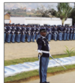
Mpianatra ho zandary eto aminitsika.

Toy izao ireo tsara ho fantatra momba ny fifaninanana hidirana ho mpianatra zanadary andiany faha7, taona 2019-2020. Ny dingana voalohany amin'izany dia hatao ny 23 sy 24 novambra 2019 manomboka amin'ny 08 ora 30 minitra maraina eny anivon'ny faritra misy vondron-tobim-pileovy ny zandarimariam-pirenena manerana ny nosy. Ny fifaninanana dia misokatra ho an'ny zatovolaha sy zatovovavy, isany 1200: -825 no alaina amin'ny mpiadina sivily lahy, -120 ho an' ny vavy, -100 miaramila amperinana na miaramila teo aloha nahavita fonopampirenena . -75 ho an' ny kamboty sy vady navelan'ireo zandary maty nandritra ny fanatanterahana ny asa voabaiko. -80 ho an'ny mpiadina manana fahaizana manokana, ka 10 mahakasika informatika sy fifandraisan-davitra - 40 mahakasika ny familiana sy ny fikojakojana fiarakodia - 10 manana traikefa manokana amin'ny fanatanjantana - 20 mpanao tao-trano, ka 05 plombiers - 05 mahakasika ny teknikan'ny fampangatsiahana (froids), 05 mpanao trano ary 05 mpanao asa momba ny vy.