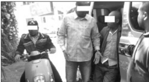
Ireo jiolahy mpanafika sy mpitaingina scooter tany Antsirabe.

Tambazotran-jiolahy mpanafika, mpitaingina scooter nikasa handroba vola 120 tapitrisa Ar no trahakany ny Polisim-pirenena Commissariat Central (C C) Antsirabe. Olona miisa 06 no voasambotry ny Polisim-pirenena CC Antsirabe ny herinandro lasa teo, tany Vatofotsy mahakasika ny fahaverezana volana mpamogady 01 teny an-toerana, izay mitentina 120 tapitrisa Ariary na 600.000.000Fmg.