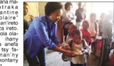
Ny avy amin'ny fikambanana Manda, nanolotra fanampiana teny Ambohidrapeto.