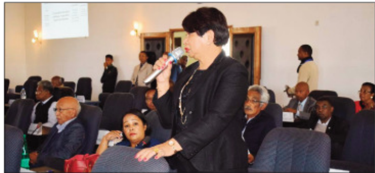
Ny fivoriana tetsy amin'ny Antemierandoholona Anosikely.

Hihaona amin'ireo senateran'i Madagasikara etsy amin'ny Lapa Maitso Anosikely anio ny Praiministra Ntsay Christian sy ny governemanta, amin'izany no hanehoany amin'ireo mpikambana amin'ity andrimpanjakana ity ny fandaharanasa ankapoben'ny fitondram-panjakana. Mikasika ny fandaharam-potoanan'ny fivoriana ao amin'ity andrimpanjakana mpanao lalana ity, lany ny herinandro lasa teo izany, nandritra ny fivoriana azon'ny besinimaro natrehana. Ny Alarobia 14 Aogositra 2019 teo, ka tsy hifarana raha tsy ny Zoma 23 Aogositra 2019 ny fivoriana tsy ara-potoana atrehan'ny ao amin'ity andrimpanjakana ity koa. Araka ny voalaza teo, hisy ny fampahafantaran'ny Praimi-