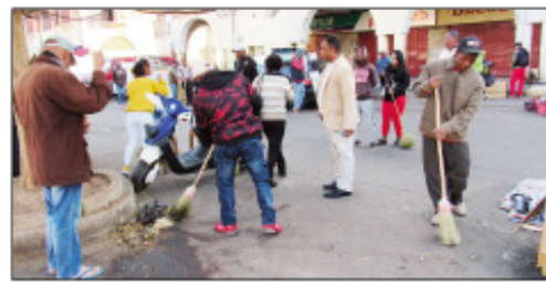
Ny fanadiovana faobe tetsy Analakely sy ny manodidina nataon'ny Boriboritany voalohany.

Miezaka hatrany ny ekipan' ny Boriboritany Voalohany amin'ny fanadiovana ny Tananan'Antananarivo Renivohitra, porofon'izany ny fisian'ny fanadiovana faobe izay ataon'izy ireo isaky ny Alatsinainy, Zoma sy Sabotsy, ankoatra ny asa fanadiovana izay efa fanaon'izy ireo amin'ny andavanandro. Na dia eo aza anefa izany ezaka izany dia mbola hita hatrany fa maloto sy maimbo ny tanàna satria ny ankamaroan'ireo mponina dia mbola manary ny fakony etsy sy eroa, ireo mpatory an-dalana ihany koa etsy andaniny dia manao ny ataony amin'ny fanavana maloto manerana ny tanàna, ka mileraka fahasorehana ho an'ny hafa izany. Koa manentana ny be sy ny maro ny tompon'andraikitra avy eo anivon'ny Kaominina Antananarivo Renivohitra (CUA), mba samy ho saro-piaro amin'izany fahadiovan'ny tanàna izany sy hahatsiaro ho tompon'andraikitra, ka sahy hifampiteny sy hifanoro raha mahita olona