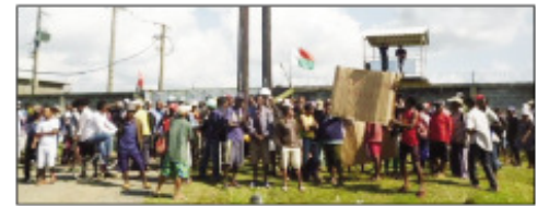
Ny fitokonnan'ny mpiasa any Tanandava Toamasina faha-2.

Natsahatry ny fanjakana ny orinasa mpanao menaka fihinana "Madagascar Premium Oil". Fitokonana no nasetrin'ny mpiasa ny fanapahan-kevitra ny fanjakana nanatsahatra ny asan'ny "Madagascar Premium Oil" io, izay orinasa mpanao menaka miorina any Tanandava-Toamasina II. Ny 23 Janoary 2018, fony Randrianarisoa Guy Rivo minisitry ny indostria, dia nahazo alalana ara-panjakana hanangana ny orinasa ny hananganana izany ny tompony. Mbola nohamafisin'ny minisitra Randrianarivo Hajo tamin'ny didim-pitondrana laharana 5098/2019 izany ny 21 martsa 2019, izay namonga fahazoan-dalana amin'ny fananganana ny orinasa. Ny 5 aogositra 2019, namoaka didim-pitondrana laharana 16.088/2019 mampitsahatra ny asa indray anefa ny Minisitry ny Indostria, ny Varotra, sy ny Asa tanana Lantsoa Rakotomalala. Nohamafisin'ny minisitra Hajo Andrianarivo tamin'ny didim-pitondrana 16.979/2019 nivoaka ny 14 aogositra 2019 izay nanafoana ny didy noraisiny teo aloha ihany koa io didim-pitondrana navoakan'ny minisitra Lantsoa Rakotomalala io. Nentin-katezerana ny mpiasa manoloana izao fiovan-kevitra tampoky ny fanjakana izao, ka dia nanomboka fitokonana tamin'ny zoma teo, ary milaza ny mbola hanohy izany. Mivoaka ny resaka fa fifaninanana eo amin'ny samy orinasa mpanambotra menaka fihinana no ao ambadik'izao raharaha izao.