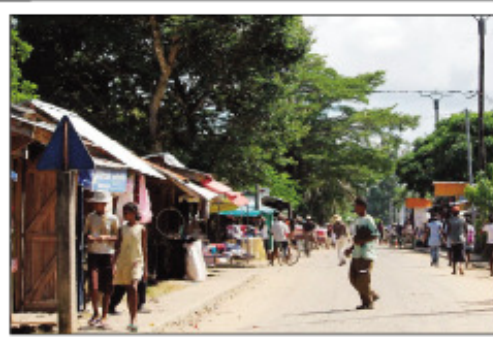
Ny tanànan'i Mahanoro.

Heriverina ny hananganana orinasa madinika any amin'ireo kaominina mandrafitra ny distrikan'i Mahanoro any amin'ny faritra Atsinanana, ho fanodinana ireo vokatra fanondrana any an-toerana, fiaraha-miasa amin'ny fikambanana AMB, na Association Madagascar Bretagne any Frantsa. Nisy ny loabary tany amin'ny Kaominina Bet-sizaraina Mahanoro sy tao Mahanoro renivohitry ny distrika ny zoma sy ny sabotsy teo, loabary andasy fakan-kevitra nije-rena ny fampandrosoana ity distrika ity. Nandray anjara tamin'izao loabary an-dasy fakan-kevitra momba ny fampandrosoana ny distrikan'i Mahanoro izao ireo sokajin'olona samy hafa avy ao amin'ny distrika, nahitana : solontenanpanjakana isan-tsokajiny, olom-boafidy: ny depiote sy ireo ben'ny tanàna, mpitandro filaminana, tangalamena, sefo fokontany avy amin'ireo kaominina mandrafitra ny distrika, olon-tsotra