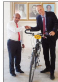
Ny fanolorana bisikileta tao amin'ny Lapan'ny tanàna Analakely.