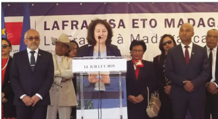
Ny lanonana teny Ivandry ny alahady lasa teo.