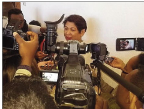
Ny sekretera jeneralin'ny antoko TIM, tetsy amin'ny ministeran'ny atitany Anosy omaly.