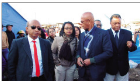
Ny iraka avy amin'ny CUA, nitondra fanampiana ho an'ireo traboina.

Trano 20 tafo no may kila fohitra ny sabotsy 13 jolay lasa teo tokony ho tamin'ny 6 ora 30 minitra hariva, teny amin'ny fokontany Andravoahangy Tsena, Boriboritany faha-3, Kaominina Antananarivo Renivohitra (CUA). Tao anatin'izany dia mponina miisa 77 no tsy manan-kialofana, izay ahitana mpianatra sy vehivavy bevo-hoka. Tsy nijery fotsiny ny fahavoazana nahazo ny mponina ny kaominina Antananarivo Renivohitra, fa avy hatrany dia naniraka ireo mpiarami-miasa aminy ny ben'ny tanàna Lalao Ravalo-manana hijery akaiky ireo traboina sy hiton-