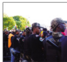
Ny fitsenana ny Barea ny sabotsy teo.

Ny Polsim-pirenena dia mitondra ny fisaorana sy fankasitrahana ho an'ny vahoaka Malagasy tamin'ny fitsenana makotroka nomena ny Barea ny Sabotsy lasa teo. Raha mahakasika ny filaminana manokana dia tsy nahitana fandikandalana izany fa nana-raka ny torolalana avokoa ireo vahoaka na dia nisy aza ireo olona maro nentanin-kafaliana be loatra, ka nibahana ny lalana nandalovan'ny