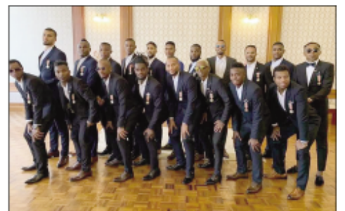
Ny sasany amin'ny mpilalao ny Barea notolorana mari-boninahitra.