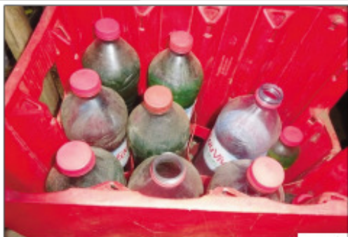
Amin'ny tavoahangy toy izao no ivarotana sy ividianana solika any an'elakelatrano any Sambava.