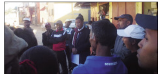
Ny fivoriana tetsy Besarety ny faran'ny herinandro teo.