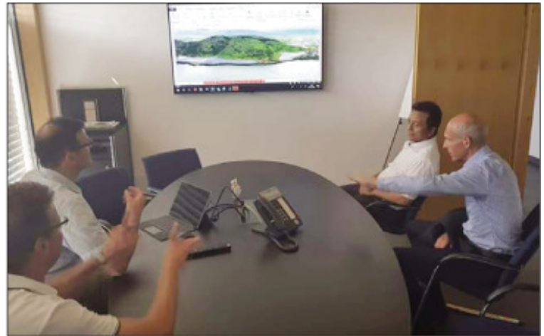
Ny didimpoitra maimaimpoana faobe tao amin'ny Boriborintany faha-3, CUA.