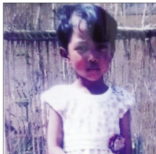
Ilay zazavavy kely nisy naka an-keriny.