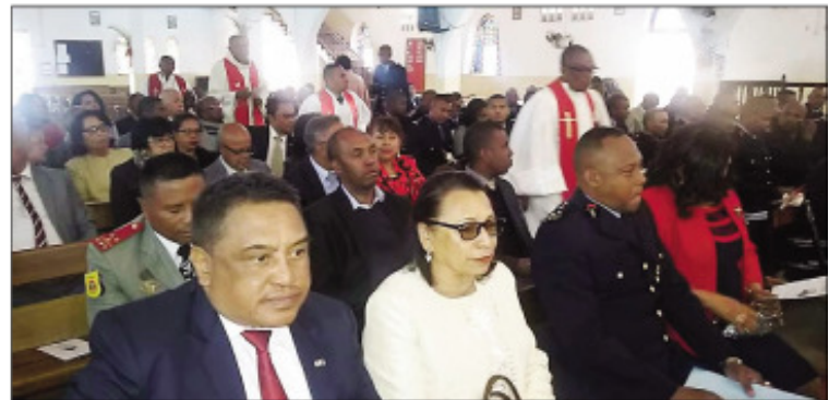
Ny fotoam-pivavahana iraisam-pinoana tetsy amin'ny Chapelle Militaire Ampahibe.