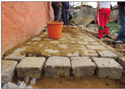
Lalankely amboarina eny Andohatapenaka Boriboritany voalohany.