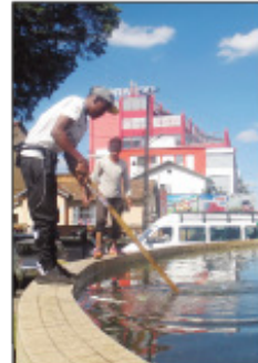
Ny fanadiovana tetsy amin'ny rano mipotsitra Rond Point Antanimena.

Nanadio ny rano mipotsitra na « fontaine d'eau » tetsy Antanimena