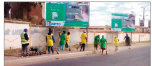
Ny fanadiovana nataon'ny Boriboritany faha-5 teny Ivandry, ka hatrany Alarobia.