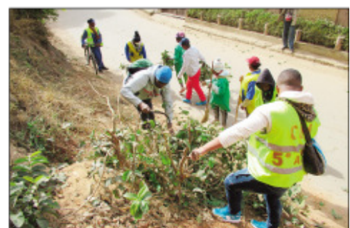
Ny fanadiovana nataon'ny Boriboritany faha-5.