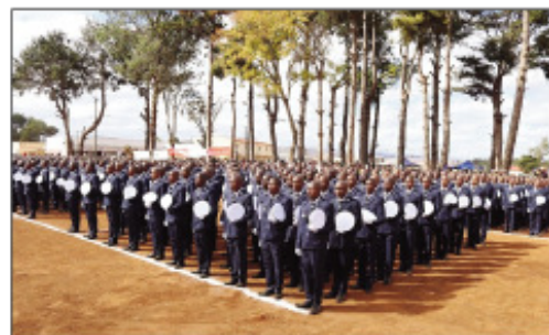
Ireo polisy vao navoaka tamin'ny fomba ofisialy omaly tany Antsirabe.