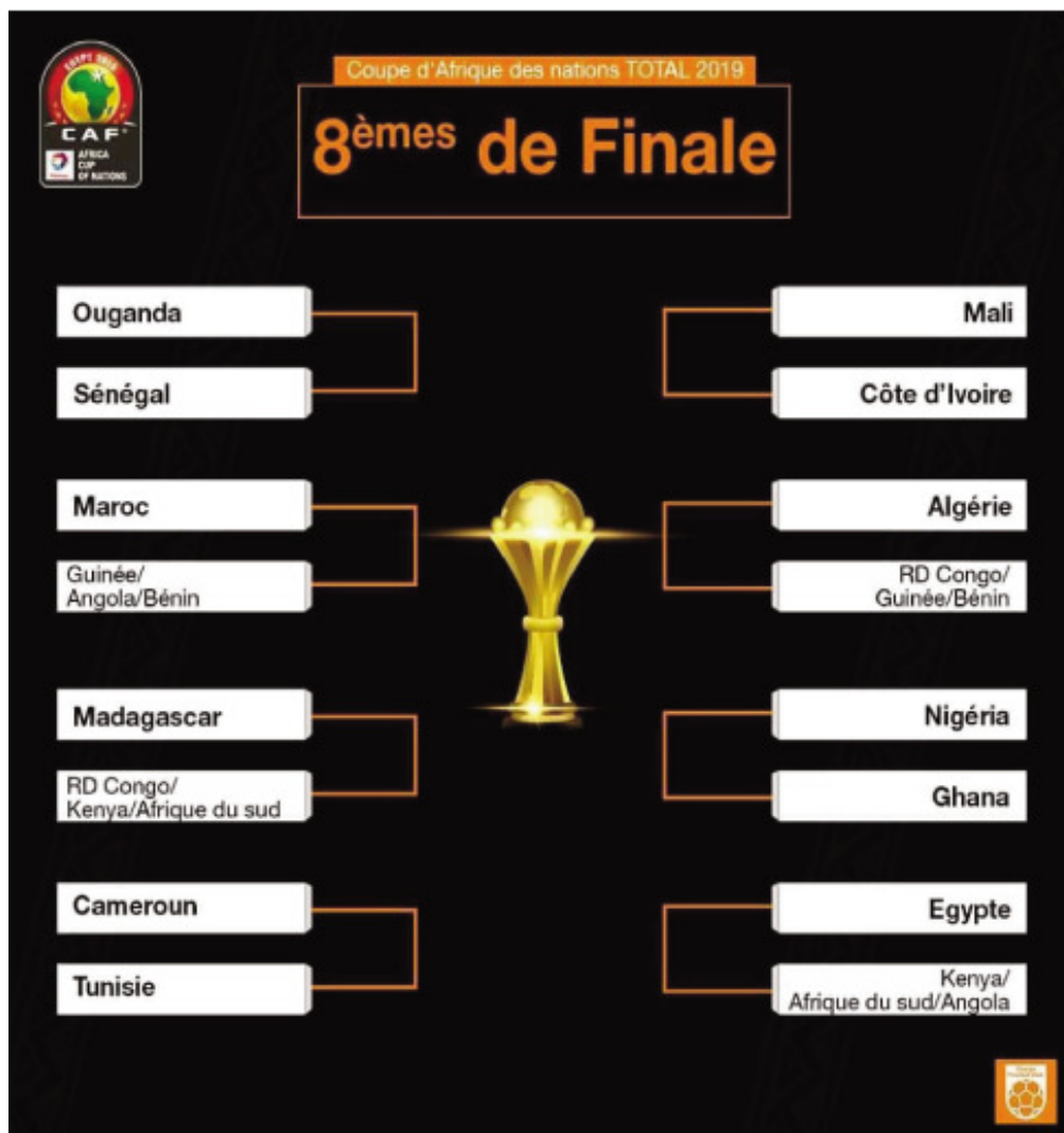
Ireo ho fandaharan-dalao amin'ny 1/8-dalana ny CAN 2019.