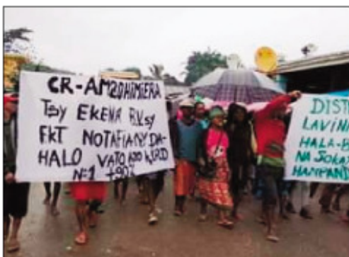
Ny hetsika tany Ifanadiana ny faran'ny herinandro teo.

Nihetsika ny mponina tany Ifanadiana faritra Vatovavy Fitovinany, ny faran'ny herinandro teo, noho ny olana nitranga tamin'ny fifidianana depiote tany an-toerana. Tsy manaiky ireo hala-bato sy ny teritery natao tamin'ireo mpiasam-panjakana sy ny fampiasana fitaovam-panjakana nampandianana ny kandidam-panjakana ny vahoaka any anivon'ny Distrikan'Ifanadiana. Na nikija aza ny orana dia nampiseho ny heviny ankalalahana izy ireo ary vonona ny hitolona hatramin'ny farany, tsy izahay mpitarika no nanga-