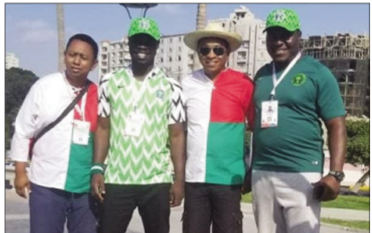
Ny didimpoitra faobe nataon'ny Boriborintany faha-4 CUA ny sabotsy teo.