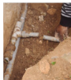
Ilay halatra rano nisy teny Ambanidia.