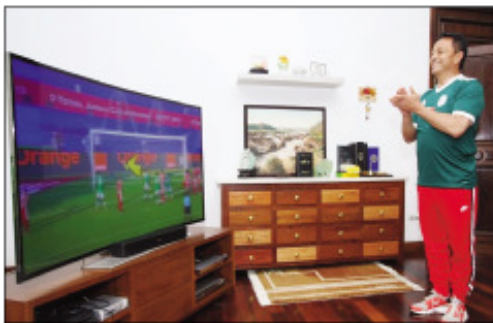
Ny Filoha Marc Ravalomanana, nanaraka ny lalao'ny Barea, teny amin'ny trano fonenany teny Faravohitra.