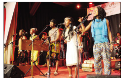
Ny fampisehoana nataon'ny Collectif Lamba 1 tetsy amin'ny AFT Andavamamba.