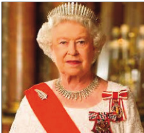
Ny fankalazana ny fetin'ny Mpanjakavavin'i Angletera tetsy Ankorondrano.

Nankalazaina ny talata 04 jona 2019 teo ny fitsingerenan'ny faha 93 taona nahaterahan'ny Mpanjakavavin'i Angletera Elisabeth II. Tetsy amin'ny Masoivohon'ny Royaume Unie Ankorondrano no nanatanterahana izany, izay natrehan'ireo manam-boninahitra maro sivily sy miaramila ary ireo Masoivoho mipetraka sy monina eto Madagasikara. Anisan'ny niatrika izany ny Filohan'ny Antenimierandoholona Rakotovo Rivo. Raha tsiahivina ny tantara dia ny Mpanjakavavy Elisabeth II dia teraka tamin'ny 06 febroary 1952 tany Londres, efa nanjaka 67 taona sy 74 andro izy, fitondrana lava indrindra teo amin'ny tantaran'ny Anglisy. Niavaka tanteraka ny fankalazana tamin'ity