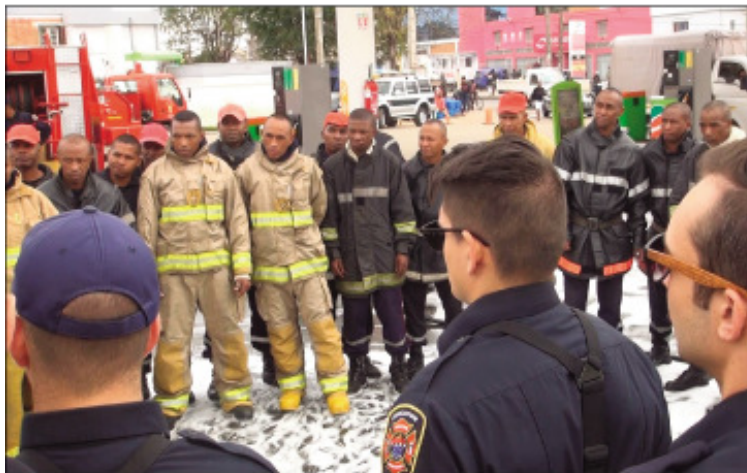
Ny fihanaana teo amin'ny Polisy Monisipalin'ny CUA sy ireo mpitatitra sy tompona posy sy sarety, tetsy amin'ny Tranompokonolona Isotry.