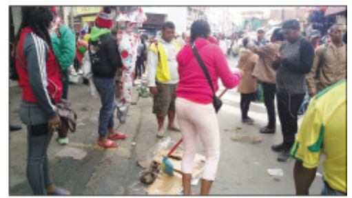
Ny fanalana mpivarotra miditra anaty arabe nataon'ny CUA.