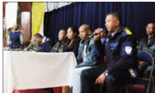
Ny famoriana ireo mpitatitra sy tompona sarety sy posy tetsy amin'ny Tranompokonolona Isotry.

A nisan'ny mampimenomenona sy mampitaraina ireo mpampiasa lalàna ny gaboraraka ataon'ireo mpitarika sarety sy posy eto Antananarivo, araka izany dia nandray andraikitra avy hatrany ny vondrona Polisy Monisipaly oamly namory ireo tompony sy mpitarika Posy sy Sarety eto Antananarivo, tao amin'ny Tranompokonolona Isotry, namafy ny fampahafantarana sy fanentanana ireto farany mba hiverina ao anatin'ny ara-dalàna satria hampiharina ny lalàna amin'ny mandika izany. Nohamafisina ary fa manomboka amin'ny 7 ora ka hatramin'ny 10 ora maraina; amin'ny 12 ora ka hatramin'ny 2 ora tolakandro; amin'ny 4 ora mandrapisavan'ny fitohanan'ny fifamoivoizana dia ora tsy azo ifamezivezen'ny posy sy ny sarety. Nohamafisina ihany koa fa tsy azo idiran'ny Posy sy ny Sarety eto ampovoan-tanàna sy ny eny amin'ny toerana fiakarana toa an'Analakely, Anosy, Mahamasina, Ambohidahy sy ny sisa... Tsy azon'izy ireo ho entina ihany koa ny entana toy ny ranon-