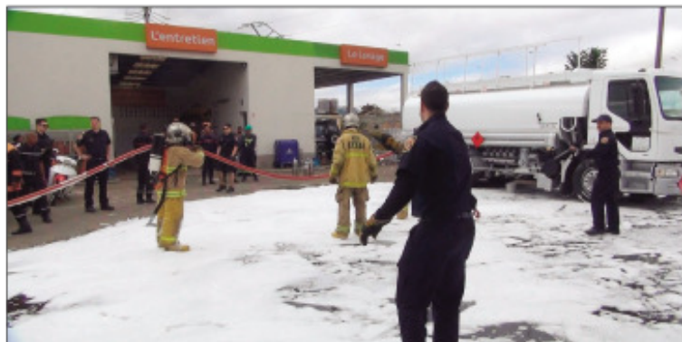
Ny fanazarantena natao teny amin'ny Galana 67 ha.