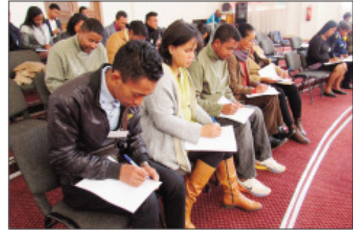
Ny fiomanana momba ny fahaiza-mitarika, tetsy amin'ny Lapan'ny tanàna Analakely.

Ny alakamisy teo sy omaly zoma tao amin'ny Lapan'ny Tanàna Analakely, ny "team building project", na fanatsarana ny fahaiza-manao ho an'ny mpiara-miasa ao anivon'ny Kaominina Antananarivo Renivohitra (CUA), niarahany tamin'ny fikambanana Gasy Youth Up. Ity fikambanana ity dia misehatra eo amin'ny lafiny sosialy, ekonomika, tontolo iainana, ny zon'ny ankizy ary tamin'ity indray mitraka ity izy ireo dia nitondra ny anjara birikiny amin'ny fampandrosoana ifotony, tamin'ny alalan'ny fitondrana sy fizarana ny fahaiza-manao ho an'ny mpiasan'ny Kaominina. Raha araka ny voalazan'ny tompon'andraikitra avy eo anivon'izany fikambanana izany dia ny fanamafisana ny firaisanki-