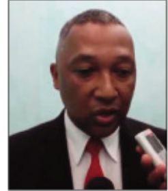
Ny delegen'ny Boriboritany faha-6.