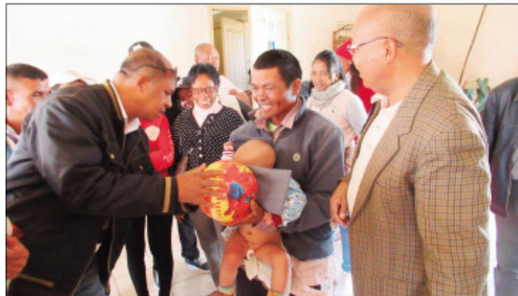
Ny didimpoitra maimaimpoana faobe tetsy Namontana.