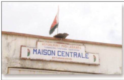
Fonjan'Antanimora, anisan'ny anaovan'ny fikambanana Lorel asa sosyaly.

Efa 5 taona izao no nioenenan'ny fikambanana Lorel, ary miompana amin'ny lafiny sosyaly ny sahanasa ataony toy ny sehatry ny fahasalamana, ny fampihenana ny tsy fanjaran-tsakafo, ny fanampiana ireo tovavy hahazaka tena hia-diana amin'ny fivarotan-tena sy hihohitra amin'ny fiainana ary ny lafiny tontolo iainana. Misy ny fiaraha-miasany amin'ny hafa ho fanatanterahana izany sahana-