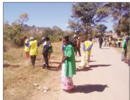
Ny fanadiovana faobe tao amin'ny Boriboritany faha-3.