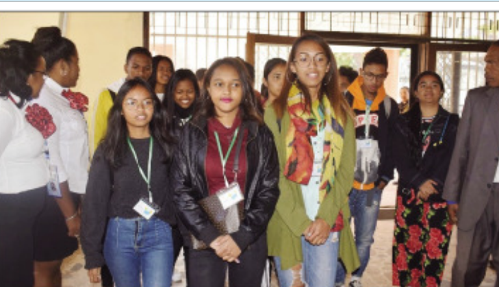
Ny sasany amin'ireo mpianatra nitsidika ny toeram-pamakiam-bokin'ny Antenimierandoholona.