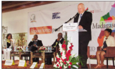
Ny ady hevitra tetsy amin'ny Hotel Carlton.

N otontosaina ny alakamisy teo, tao amin'ny Hotel Carlton Ampefiloha ny adihevitra mahakasika ny fitsinjaram-pahefana ahitam-bokany. Nodinihina tamin'izany ny fomba mety hanatsarana ny fitsinjaram-pahefana eto Madagasikara, izay nokarakarin'ny Fondation allemande Friedrich Ebert Stiftung (FES), nahitana ny fandraisana