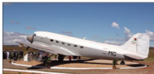
Ilay fiamanidina DC3 lasa vakoka.

fahalemana ny asany tamin'izany. Ao amin'ny