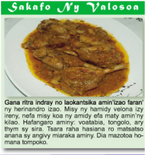
Gana ritra indray no laokantsika amin'izao faran'ny herinandro izao. Misy ny hamidy velona izy ireny, nefa misy koa ny amidy efa maty amin'ny kilao. Hafangaro aminy: voatabia, tongolo, ary thym sy sira. Tsara raha hasiana ro matsatso anana sy angivy miaraka aminy. Dia mazotoa homana tompoko.