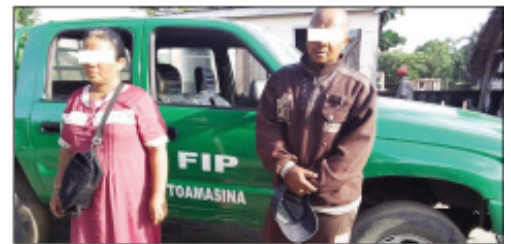
Ireo mpivady mpivarotra heroïne tratra tany Toamasina.