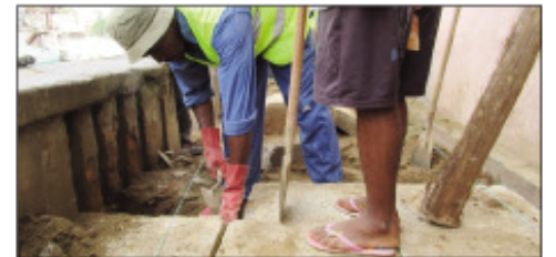
Fanamboarana lalankely ao amin'ny Boriboritany faha-6.

HIRA (urgences) : 033 11 890 58 / 22 279 79 HOMI Soavinandriana : 22 397 51 Hopitaly Befelatsanga : 22 141 141 / 22 141 21 Hopitaly Anankarivony : 22 141 21 Hopitaly Loharano : 22 441 88 / 22 485 17 Clinique des Soeurs Ankadifotsy : 22 235 54 Ambulances municipales : 22 200 40 Telma : (22)3547 (n° vert) / Airtel : 03 35 47 / Orange : 032 32 3547 Pompiers : Tél : 118 / 22 250 18 / 22 225 66 Police : Hôtel Central de Police : 17 / 22 227 35 / 22 357 09 1 er Arrondissement Tsaralalana : 22 280 54 2 e Ambanidia : 22 309 46 3 e Antananandro : 22 291 30 4 e Isotry : 22 280 51 5 e Mahamasina : 22 280 48 6 e Ambohimananina : 22 225 52 7 e 6 e Ha : 22 291 29 8 e Analamahitsy : 22 493 25 Brigade criminelle : 22 216 78 / 22 210 29 / 22 674 83 na 84 GIR : 22 227 35