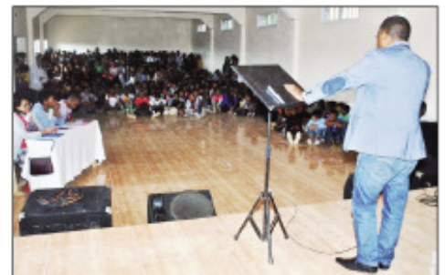
Ny fifanakalozan-kevitra teny Ankadindravola Ivato.