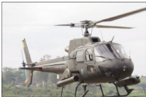
Io ankavia io ilay angindimby tokony ho entina miady amin'ny dahalo fa tsy ilay nomen'i Rajoelina.