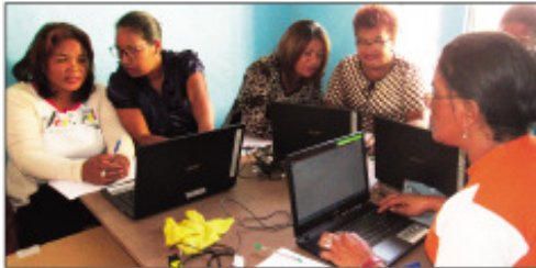
Ireo vehivavy mianatra informatika ao amin'ny Boriboritany faha-4.

Ny Boriboritany fa-hafatra Kaominina Antananarivo Renivohitra (CUA), ara-ka ny efa nahafantarana azy dia tsy sasatra ny manome fahafahampo ny olona tsirairay, ka mi-ozaka foana manohy ny asa sosialy izay fanaony hatramin'izay. Tamin'ity indray mitoraka ity dia nanolotra fampianarana informatika maimaimpoana izy ireo, izay niarahana tamin'ny mpiara miombonan'antoka « Orange Solidarité » teo amin'ny fanomezana ny fitaovana entina anatanterahina izany. Vehiva-vy miisa 54, izay mpitantana fotodrafitra asa fitoana rano fisotro madio, na ny AUE (Association des Usages de l'eau), ao anatin'ny fotokantany miisa 32 no nisis-