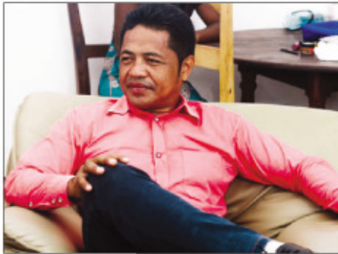
Raniry, mpanoratra sy mpanakanto any Mahajanga.

A raka ny fanadihadiana natao manerana ny Nosy dia tena vitsy dia vitsy tokoa ny olona manatona ny biraom-pokontany maka ny kara-pifidianany sy manontany ny anarany raha toa ka voasoratra soamantsara ao anaty lisi-pifidianana. Midika izany fa hidina ambany dia ambany ny tahan'ny mpifidy amin'ity ffidianana izay ho solombavambahoaka ity. Leo, tofoka, boboka tarteraka ny vahoaka, izay no azo ilazana azy, hany ka tsy te-handray andraikitra intsony ; indrindra raha ffidianana no asian-teny. Leom-boan'anana ka tsy tia zava-boribory intsony. Mety ho zaran'ny mpitorondra koa aza izany satria afaka manao izay danin'ny kibony izy rehefa ny vahoaka no tsy te-hifidy sy handray andraikitra intsony. Ireo havana akaikin'ny kandida, na koa ireo nahazo tombontsoa mivantana sisa no hany sisa mba tonga mifidy fa ny ambany dia mitokona tsotra izao ao an-tranony avokoa fa tsy te-hihirika ffidianana intsony. Tena zava-doza goavana ho an'ny firenena anefa izany tranan-javatra mampahonena izany satria vao mainka mampihitsoka lalina sy mampilitika ny firenena ao anaty lavaka mangitsokitsoky ny fahasahiranana.