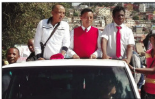
teny an-toerana ny filoha nasionalin'ny antoko TIM Marc Ravalomanana. Kandida voasedra hoy