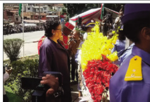
ninkazo fahatsiarovana ireo namoy ny ainy sy