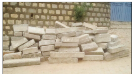
Ireo vato anamboarana lalankely eny Tsiadana.

Efa tonga eny amin'ny fokontanin' i Tsiadana Boriboritany faha-2, Kaominina Antananarivo Renivohitra (CUA) koa ireo vato tamin'ny sisina "trottoir", izay hatao lalankely. Afak'omaly ihany dia natomboka izany asa izany. Raha tsiahivina dia "bordure de trottoir", vato tamin'ny sisin-dalana, izay tsy ilaina intsony ka nalaina teny amin'ny lalana samihafa teny no noraisin'ny kaominina Antananarivo Renivohitra an-tanàna mba tsy ho very fotsiny dia izao hanamboarana lalankely izao. Ity asa izay atao ity dia fiaraha-mia-