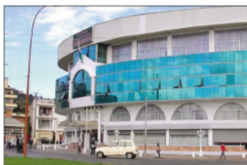
HCC ary mijanona ho jurisprudence izany. Manome endrika ratsy ny fitsarana izany raha mifanipaka amin'io ny lazain'ny HCC. Nanamba-