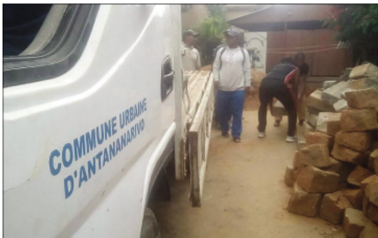
Fanamboarana lalankely teny Mahatony Soavimasoandro, Boriborintany faha-5