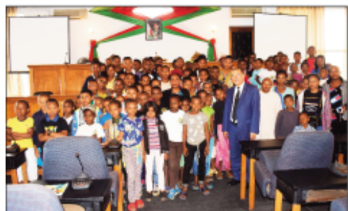
Ireo mpianatra avy any amin'ny faritra nitsidika ny tetsy Anosikely.