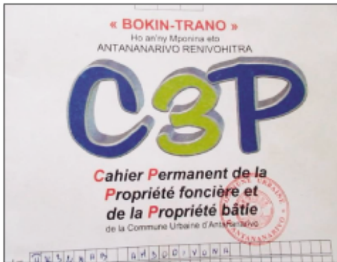
Ny bokin-trano apartaky ny CUA.

Manao ezaka fanisana ireo trano eto an-drenivohitra ny Kaominina Antananarivo Renivohitra (CUA) amin'izao fotoana. Araka izany dia nisy ny bokin-trano izay nozaraina manerana ireo fokontany 27 tao amin'ny Boriboritany faha-5, tamin'ny volana Aogositra 2018, ka hatramin'ny Febroary 2019 lasa teo. Ity Boriboritany faha-5 ity no atao filamatra na pilote amin'izay resaka bokin-trano izay. Niisa 39 000 teo ireo bokin-trano izay nozaraina tao amin'ity boriboritany ity ary mbola ny 20% ihany hatreto no namerina izany teny amin'ny kianjan'i Mahamasina, izay birao mian-drakitra izany eto anivon'ny Kaominina Antananarivo Renivohitra dia ny DMR, na ny Direction de Mobilisation des Ressources. Ny tanjona amin'ity tetikasa ity dia ho voaisa ary mba hanana mari-pamantarana