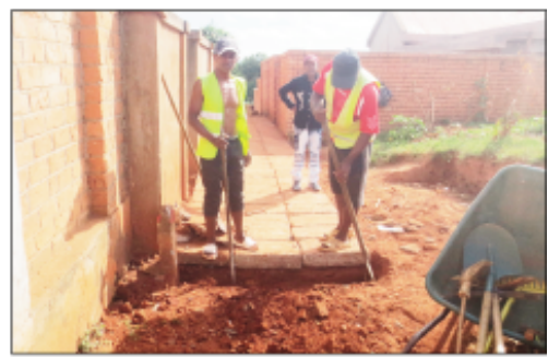
Lalankely atao eny Mahatony- Soavimasoandro.

H o fitsinjovana ireo mponina eny ifotony dia mitohy hatrany ny asa fanamboarana lalankely tantehin'ny Boriboritany fahadimy, Kaominina Antananarivo Renivohitra (CUA). Teny Mahatony - Soavimasoandro indray no nanatanterahana ny asa, lalankely mirefy manodidina ny 150 m no namboarin'ireo ekipa teknika avy eo anivon'ny boriboritany. Ireo vato tamin'ny sisina "trottoir" nesorina nandritra ny tetikasa ARM (Autorité Routière de Madagascar), ataon'ny Orinasa Colas hatrany, no nalaina anamboarana ity