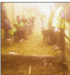
Ny fanamboarana lalankely teny Amboditsiry. mandidina ny 100m no namboarina nandritra

Mitohy hatrany ny fanamboarana lalankely ataon'ny Boriboritany fahadimy kaominina Antananarivo Renivohitra (CUA), amin'ny alalan'ireo vato nalaina tamin'ny sisina "trottoir", nesorina vokatry ny fiarahamiasan'ny Kaominina Antananarivo Renivohitra sy ny Orinasa Colas, tamin'ireo lalam-pirenena mivoaka ny renivohitra dia ny RN1, RN2, RN4 ary RN7. Lalana mirefy