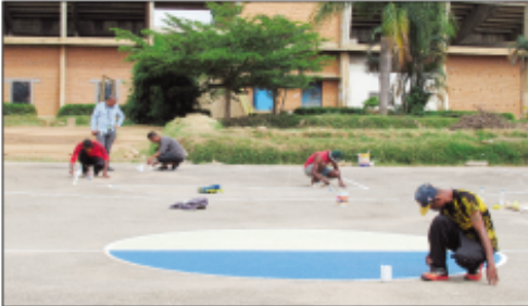
Ny fandokoana kianja etsy Mahamasina.

Taorian'ny fetin'ny Paska ny faran'ny herinandro lasa teo dia nanatantarako fanadiovana sy fandokoana ny kianja filalovana basket-ball sy volley-ball eny Mahamasina, ny avy eo anivon'ny Sampandraharaha misahana ny kolontsaina sy ny fiainam-piaraha-monina, na DCVC, eo anivon'ny Kaominina Antananarivo Renivohitra (CUA), nanomboka ny 23 ka hatramin'ny 26 aprily 2019 izany asa izany. Nandritra izany dia nisy ny fanapahana ireo bozaka sy lolobolo, nanatsara sy nandoko (marquage) ny toerana filalovana baolina. Nisy ihany koa fanondrahana rano na-