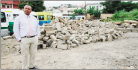
Ny talen'ny asa vaventy ao anivon'ny CUA.