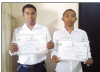
Solontena avy amin'ny Kaominina Ivato, anisan'ny niatrika fiofanana momba ny fananan-tany tany Miarinarivo.

Natao tany Miarinarivo faritra Itasy ny 19 febroary ka hatramin'ny 27 martsa lasa teo ny fiofanana momban'ny fananan-tany sy ny fanatsarana ny tanàna, izay notontosain'ny INDDL (Institut National de la Décentralisation), na Ivon-toeram-pirenena momba ny fitsinjaram-pahefana. Solontena avy amina vondrom-bahoakam-paritra