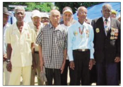
Ny sasany amin'ireo Bekotromaroholatra any Boeny.