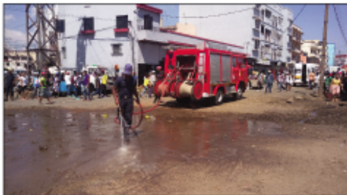
Ny fandaminana sy fanadiovana ny tsenan'Andravoahangy.