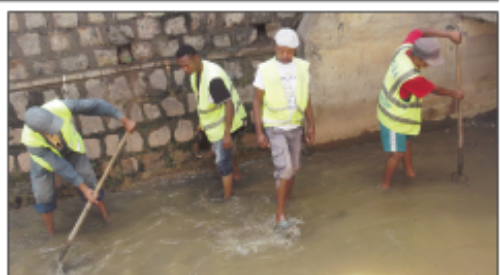
Ny fanadiovana tatatra nataon'ny tao amin'ny Boriboritany faha-5.

an-toerana. Nandritra izany dia nosokirina ireo fako niangona tao anatin'ity lakandrano ity mba hahafahan'ny rano mikoriana tsara. Entanina hatrany ny mponina mba tsy hanary fako any anatin'ireny tatara ireny hisorohana ny mety ho fiakaran'ny rano, indrindra amin'izao fotoana ihavian'ny orana izao.