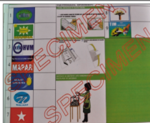
Santionan'ny biletà tokana tamin'ny fifidianana teo aloha.