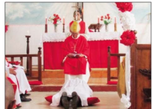
Ny fanamasinana ny Eveka Anglikana vaovao any Mahajanga faritra Boeny.