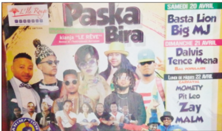
Afisy amin'ny fety hisy any Antsirabe.

Efa miaina anaty fety tanteraka ny tanànan'Antsirabe ary azo lazaina fa han-gotraka tanteraka ny fan-kalazana ny fetin'ny Paka eny an-kianja, ankoatry ny any am-piangonana amin'ny maha fety Kristianina azy. Raha ny zava-misy dia ny Zoma no hanomboka ny fanka-lazana saingy amin'izao fotoana dia efa vory lanona avokoa ireo mpise-hatra amin'ny lafiny fia-lam-boly. Toy ny maha-zatra dia efa nofandri-han'ny orinasa mpamo-katra labiera hatrany ny araben'ny fahaleovan-tena ka ampahany sisa no azon'ny Orinasa Co-madis izay mpamokatra zava-pisotro ihany koa. Raha resaka fifanina-nana dia azo lazaina fa efa sahy sy mahasa-hana ny hetsika ataon'ny orinasa hafa ny Orinasa Comadis satria nanofa toerana manokana mi-hitsy izy ireo no sady