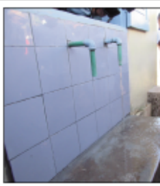
Foto-drafitrasa notokanana teny Andranoambo Andohatapenaka.