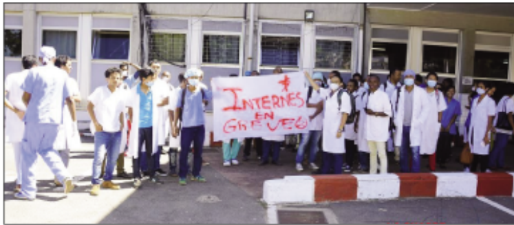
Ny grevy nataon'ireo mpianatra ho mpitsabo tetsy amin'ny HJRA Ampefiloha.

Mitokona amin'izao fotoana izao ireo mpianatra ho mpitsabo antsoina hoe "internes". Manome 24 ora ny fanjakana ireo mpianatra ho mpitsabo « internes » miasa amin'ny hospitalim-panjakana eto Antananarivo ireo, mba handoavana ny tambin-karamany izy ireo nandritra ny efa-bolana. Mpianatra taona fahafito sy fahavalo ao amin'ny sampam-pampianarana ho mpitsabo eny amin'ny Univesite ireo « internes » ireo ary efa manomboka miasa ao amin'ny hospitalim-panjakana. Miandraikitra ny fampihodinana ny hospitaly amin'ny ankapobeny ireto 'internes' ireto, ka isan'