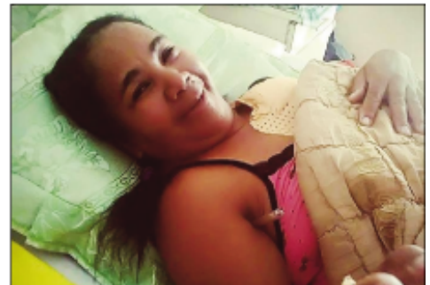
Vololona, avy amin'ny antoko TIM ao amin'ny Boriboritany faha-6.