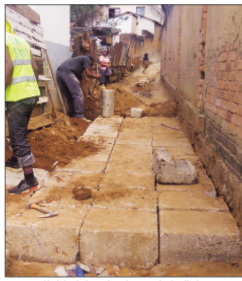
Ny lalankely amboarina eny Amboditsiry.

Ho fitsinjovana ireo mponina dia nanamboatra lalankely mirefy 100m eo ho eo ny avy eo anivon'ny boriboritany fahadimy, Kaominina Antananarivo Renivohitra (CUA) ny 11 Aprily teo. Vatona "trottoir" nesorina avy amin'ny projet ARM (Autorité Routière de Madagascar) sy ny orinasa Colas, no narafitra anamboarana ity lalankely ity, noho ny fiaraha-miasa eo amin'ity orinasa ity sy ny Kaominina Antananarivo Renivohitra, eny Amboditsiry. Teo aloha dia nijaly tokoa ny mponina maro mpampiasa ity lalana ity rehefa fotoam-pahavaratra, ka izay indrindra no nahatonga ny fiadidina ny tanànan' Antananarivo nandray andrakitra nikarakara azy ireo. Niaranatanteraka ity asa ity ny ekipa teknika avy eo anivon'ny boriboritany fahadimy sy ny avy eo anivon'ny Direction des travaux Publics (DTP) eo anivon'ny fitantanana ny tanànan'Antananarivo Renivohitra. Andrana voalohany ihany ity fanamboarana lalankely eo Amboditsiry ity fa mbola ho tohizana any amin'ireo fokontany 27 ao anatin'ny boriboritany fahadimy, araka ny nam-