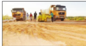
Tsy izao no efa fanamboarana nataon'ny Filoha Rajoelina ny fanamboarana ny lalam-pirenena RN 5 A mampitohy an'Am-bilobe sy Vohémar.

Tena mpijapy ny nataon'ny teo aloha ny filoha Rajoelina. Tamin'ny 16 aogositra 2018 no natomboka tamin'ny fomba ofisialy ny asa fanamboarana ny lalam-pirenena RN 5 A mampitohy an'Am-bilobe sy Vohémar. Ny filoha teo aloha Hery Rajoelina izany no nanokatra izany lalana mirefy 150 km izany, efa vita fifanarahana fa ny EXIM banque no hamatsy ny vola mitentina 155 tapitrisa dolara amerikana ary ny orinasa China Road and Bridge no tompon'antoka amin'ny famitana azy. Ny volana jona 2018 no saika hatomboka ity asa ity fa ny volana aogositra vao niainga, nandà tsy hamatsy vola ny asa mantsy ny Union européenne ka ny Sinoa avy eo no nanaiky. 24 volana no fe-potoana hanamboaran'ny orinasa azy. "Bye bye Gödra" hoy ny teny re tamin'izany, araka ny fantatra dia efa vita "terrasement" ny 30km amin'ilay lalana ary efa voapetraka ny vato fototra tamin'io datin'ny 16 aogositra 2018 io. Ho taratry ny fampihavanam-pirenena ny fahavitan'ity lalana ity hoy ny filoha teo aloha satria faritra roa, Diana sy Sava, no hampifandraisiny. Dia anio ny Filoha Rajoelina any amin'ny faritra iny, hametraka ny vato fototra fanamboaran-dalana indray sa inona koa no ataony any? Mampihomehy mihitsy ilay filoha tsy mikatona loha-malemintsika amin'izao fotoana izao ity. Ilay IEM aloha dia tsy misy resaka, tsy misy tokontaniny ny momba azy.