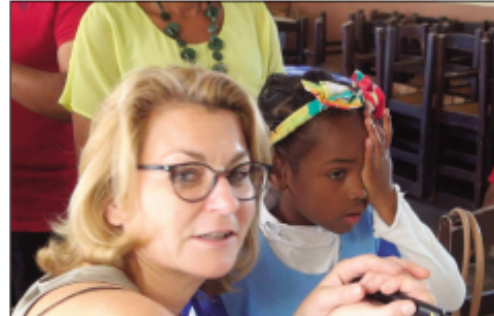
Ny fitsaboana maso nataon'ny avy any Vardoise Frantsa.

Nahazo tombony amin'ny fizahana maso sy fizarana solomaso maimaim-poana avy amin'ny fikambanana tsy miankina any Vardoise Paris Frantsa, ny ankizy mpianatra ao amin'ny sekoly EPP FJKM Rasalama, Boriboritany faha-3, ny alakamisy teo. Ankizy mpianatra miisa 100 mahery ao amin'ity sekoly ity no nisitraka izany. Izao hetsika ara-pahasalamana izao dia tohin'ny fiaraha-miasa efa natao antaonany maro miaraka amin'ny Kaominina Antananarivo Renivohitra (CUA) ary tafiditra amin'ny vinan' ny Ben'ny Tanàna Lalao Ravalomanana ny amin'ny fiahiana ara-tsosialy ny mponina, ao anatin'izany ny vehivavy sy ny ankizy. Tsy hijanona ho an'ny ankizy mpianatra ao amin'ny sekoly EPP FJKM Rasalama ihany ny hetsika fa hitohy ary nahazo izany fiahiana sosialy mahakasika ny