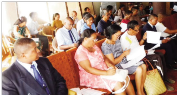
Ireo mpiofana momba ny ady amin'ny kolikoly tetsy amin'ny foiben'ny FJKM Analakely.