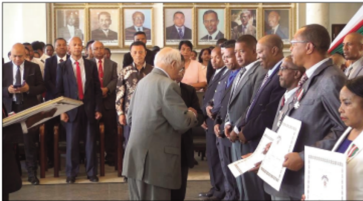
Ny lanonana fanolorana mari-boninahitra tao amin'ny Lapan'ny tanàna Analakely.