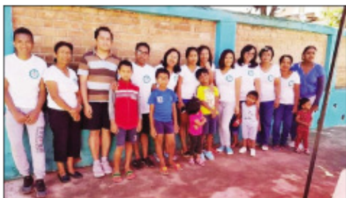
Fiaraha-miasa amin'ny fikambanana roa eny amin'ny Boriboritany faha-6.