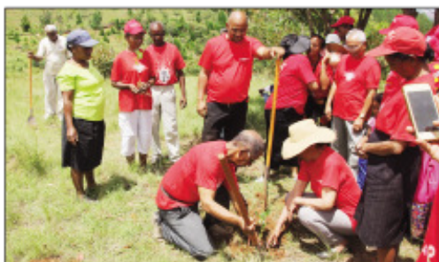
Ny fambolena-kazo nataon'ny antoko Arema teny amin'ny kaominin'i Tsiafahy, Atsimondrano.