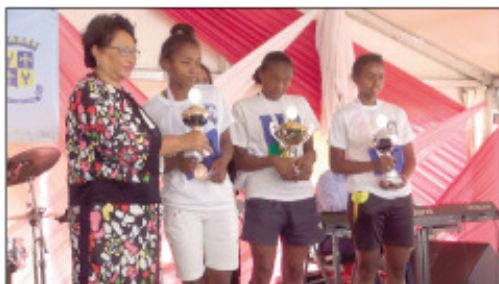
Ny lanonan'ny 8 martsa tetsy Analakely omy.