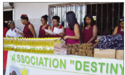
Ny fankalazana ny 8 martsa teny Ivato.