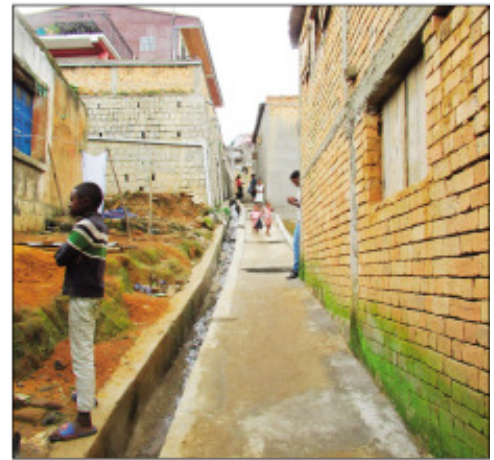
Lalankely anisan'ny vita tao amin'ny Boriboritany faha-VI.