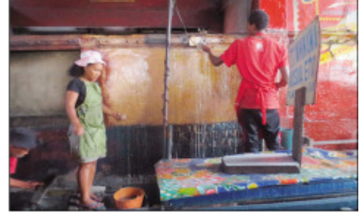
Ny fanadiovana ny tsena fivarotan-tsakafo Zaimaika tetsy Analakely.

Anisan'ny maha saroro-piaro sy zavadehibe ho an'ny mpitantana ny Kaominina Antananarivo Renivohitra (CUA), ny fahasalaman'ny mponina ary miezaka hatrany izy ireo amin'ny fanaraha-maso akaiky ny fahadiovana sy ny kalitaon'ny sakafo eny anivon'ireo toeram-pivarotana hani-masaka. Noho izay indrindra dia nidiana tanteraka ny tsena fivarotana hani-masaka Zaimaika ny tontolo andron'ny alakamisy teo noho ny fanadiovana goavana izay niarahan'ireo rantsamangaika avy eo anivon'ny Kaominina Antananarivo Renivohitra, toy ny mpanadio avy eo anivon'ny Boriboritany Voalohany, ny Sampana Mpamonjy Voina, ny BMH, ny solontenan'ny mpivarotra ao amin'ny Zaimaika, ny mpitantana ny tsena. Marihana fa isaky ny telo volana no fanaovan'izy ireo ny fanadiovana goavana toy