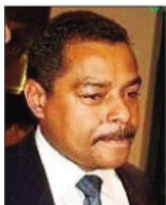
Ny talen'ny TVM nesorina.