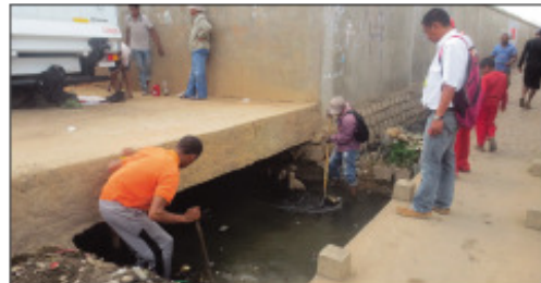
Ny fanadiovana tatatra, fiaraha-miasan'ny Boriboritany sy ny fokontany ao amin'ny Boriboritany faha-6.

Mampikaikaika ny mponina eny Ankazomanga Atsimo, Boriboritany faha-6, Kaominina Antananarivo Renivohitra (CUA), ny fahatsentsenan'ny lakandrano, ka mahatonga ny fiakaran'ny rano eny amin'ity fokontany ity isaky ny fotoam-pahavaratra toy izao. Tsy nisalasalana ary tonga dia nandray ny andraikiny avy hatrany ireo ekipa mpandio avy eo anivon'ny Boriboritany faha-6 tamin'ny fanokafana sy fanadiovana ny tatatra vaovao, izay namboarina ny fokontany, mba hahafahan'ny rano maloto mikoriana tsara araka ny tokony ho izy. Marihana fa ao anatin'ny fanatanterahana tantearaka ny vina 100 andron'ny Ben'ny Tanàna izay tanterahan'ny Boriboritany faha-6 ny fanadiovana tatatra madinika any anaty fokontany toy izao. Nanampy ny ekipa mpandio avy eo anivon'ny Boriboritany faha-6 ny Rafitra Fidiavana sy Fahadiovana na ny RF2. Nandritra izany asa fanadiovana izany ihany koa dia nanararaotra narentana ny mponina ny Kaominina mba hanaja ny fahadiovana, hanary