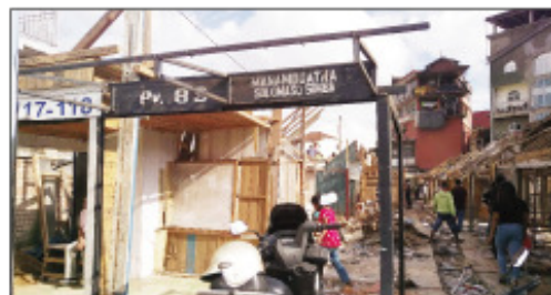
Ny fanamboarana fivarotana vaovao etsy amin'ny solomaso Andravoahangy.

Amboarina amin'izao fotoana ny tsenan'ny solomaso ao Andravoahangy ambany Boriboritany faha-3, Kaominina Antananarivo Renivohitra (CUA). Mba hialana amin'ireo trano hazo izay mora mirehitra, izay mpitranga matetika, dia nanao-kevitra ny Kaominina Antananarivo Renivohitra fa hosoloina ireo trano hazo ary hatao trano biriky, etsy amin'ny mpivarotra solomaso Andravoahangy. Miisa 153 ny isan'izy ireo ary hatao mitovy avokoa ny trano fivarotana, ka ireo mpivarotra ihany no miantoka ny fananganana azy, fa ny Kaominina kosa no manara-maso ny fananganana ny foto-