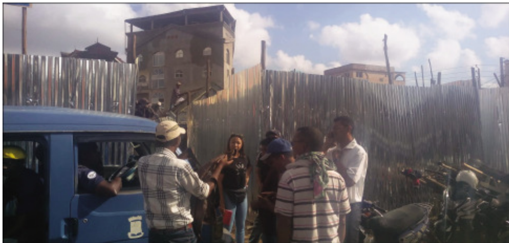
Fanadiovana tatatra ao amin'ny Boriborintany faha-6.