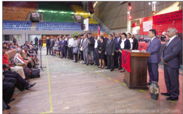
Ny fifampiarahabana tratry ny taona tao amin'ny Boriborintany faha-2 ny sabotsy teo.