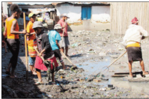
Ny fanadiovana faobe teny Anosibe Andrefana II.

Mitohy hatrany ny fanadiovana faobe izay ataon'ny eo anivon'ny Boriboritany faha4. Raha ny omaly dia ny teny Anosibe Andrefana II no nanaovana ny hetsika. Fokontany enina sy fikambanana RF2 miisa 3 no niara- isalahy tamin' izany, izay nahitana ny RF2 Ivolaniray, Mandrangobato ary Anosibe II. Niompana tanteraka tamin'ny fanalana ireo fako izay amin'ny faritra maro ny fanadiovana, teo koa ny fisokirana ireo fako amin'ireo lakandrano izay manent-