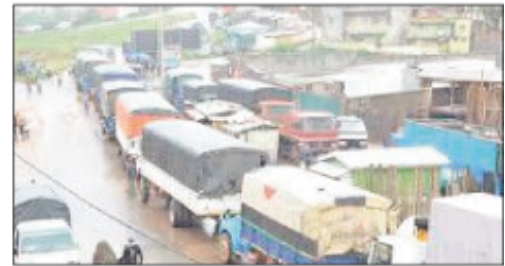
Ny fitokonan'ireo mpitatitra mpitondra kamiao teny Ambohimangakely.

Nanao fitokonana teny Ambohimangakely Antananarivo Avadradrano omaly ireo mpitatitra mpitondra fiara vaventy na kamiao. Maro ireo mpitatitra ireo no namaly ny antso tamin'izany grevy izany. Ny anton'izao fitokonana izao dia noho ny resaka mifamahofaho mahakasika ny ora azon'ny fiara vaventy ivezivezena eto Antananarivo sy ny manodidina, indrindra ho an'ireo mitondra ny vokatra avy amin'ny ala, toy ny hazo izany. Araka ny voalazan'ny ministeran'ny tontolo iainana dia amin'ny 6 ora hariva vao mahazo mivezivezy ny kamiao. Raha ny voalazan'ny ministeran'ny fita-