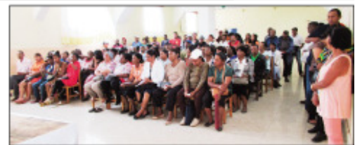
Ny fivoriambe momba ny fitantanana foto-drafitrasa tao amin'ny Boriboritany faha-4.

Ny alatsinainy teo dia nanatanteraka fivoriam-be ny teo anivon'ny Boriboritany faha4, Kaominina Antananarivo Renivohitra (CUA), izay natao tao amin'ny Espace Mon Goutier Andrefan'Ambohimangakely, niarahana tamin'ireo mpitantana ny rano sy fotodrafitra'asa eo anivon'ny boriboritany. Miisa 32 ny fokontany mandrafitra ny Boriboritany izay ahitana fotodrafitra'asa 240 mahery, toy ny fatsakana sy ny fanasan-damba, izay tan-tanin'ny fikambanana miisa eo amin'ny 184 eo. Ny anton'ny fivoriana dia ny fandraisan'ny Boriboritany mivantana ireo fitantana iraisana izay mianjady amin'izy ireo, toy ny fisian'ny hetra