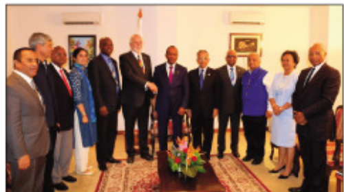
Ireo delegasiona avy amin'ny Rotary Iraisam-pirenena tetsy Anosikely.