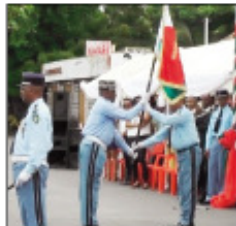
Ny famindram-pibaikona tany Mahajanga.