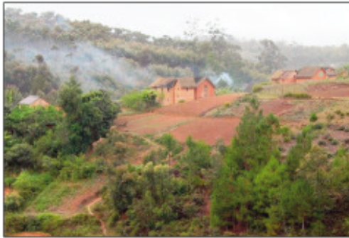
Mijaly noho ny tsy fandriampahalemana ny mponina any amin'ny distrikan'i Manjakandriana.

Mandry tsy lavo loha ny mponina noho ny asan-dahalo sy ny asan-jiolahy amin'izao fotoana any amin'ny faritr'i Vakiniadiana, distrikan'i Manjakandriana iny. Andro maromaro izay dia notafihan'ny dahalo ny tany Ambohitrandriamanitra. Ny alahady alina lasa teo indray, ny tany Ambahamaro sy Ambotrinibe, izay mbola ao amin'ity distrika ity indray no voatafika. Tsy mandry andro tsy mandry alina ny