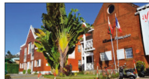
Eto amin'ny AFT Andavamamba no toerana anisan'ny hanamarihana ny herinandron'ny Frankôfônia.