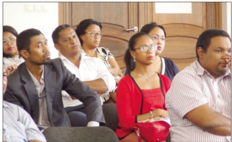
Ny fifampiarahabana tratry ny taonan'ny TIM K25 tany La Réunion.