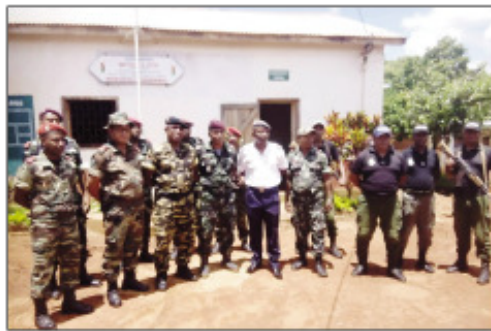
Ireo mpiandry fonja sy mpitandro filaminana any Tsiroanomandidy.