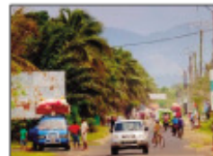
Ny tananan' Sambava any amin'ny faritra Sava.

lobolobo, ny tapany ambony, nentin'ny sasany nitely ny arabe nihazo ny lalam-pirene, nivoaka ny tokontanin'ny Hopitaly, ka tavela teo afovoan'ny arabe goudrona tara, ny tapany ambony sy ny tanany havia, araka ny fahitana azy teo dia mbola zazamenavava dongandonganga ihany ilay izy, ary tsy misy ahafantarana azy na lahy na vavy, satria efa lanin'ny alina ny tapany ambany. Niteraka fitohan'ny fifamoivoizana nandritra ny ora vitsivitsy