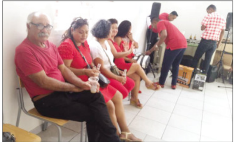
Ny fitsaboana maimaimpoana nataon'ny Boriborintany faha-4 ireo tra-boina tetsy Ampamarinana, tao amin'ny INFP.