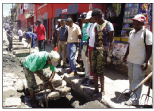
Fanadiovana lakandrano tao amin'ny Boriboritany faha-3.

N anohy asa goavana fanadiovana tatatra sy lakandrano ny Kaominina Antananarivo Renivohitra (CUA) foibe, sy ny Boriboritany fahatelo omaly maraina. Faritra maro ao amin'ny boriboritany fahatelo no anatanterahana izany fanadiovana izany toy ny : tetsy Besarety, Ampandrana, Andravoahangy Atsinanana, Mahavoksy sy ny mandodina. Omaly dia nantomboka teo amin'ny Rasalama nihazo an'i Besarety midina hatrany amin'ny Garage David iny ny fanadiovana lakandrano na caniveau manamorona ny arabe sisiny 2, izay vinavinaina ho vita ao anatin'ny 4 andro, ka ny fanalana ny fako sy ny fasika no tena natao tamin'izany ary ny faniliana ny ireo saronana "dalle" mba hanamora ny fanadiovana. Nanatanteraka ny asa teny antoerana ny "Equipe Mobile d'Intervention" miisa 16 lahy sy ny ekipan'ny