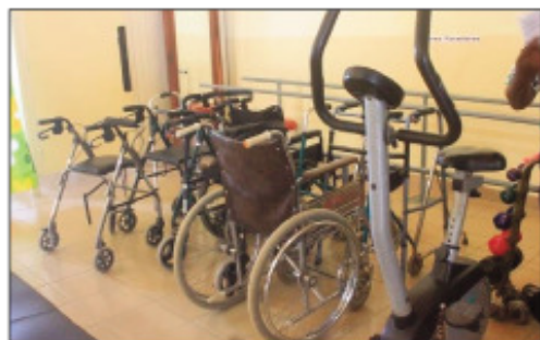
Fitaovana vao azon'ny hopitaly Androva Mahajanga.