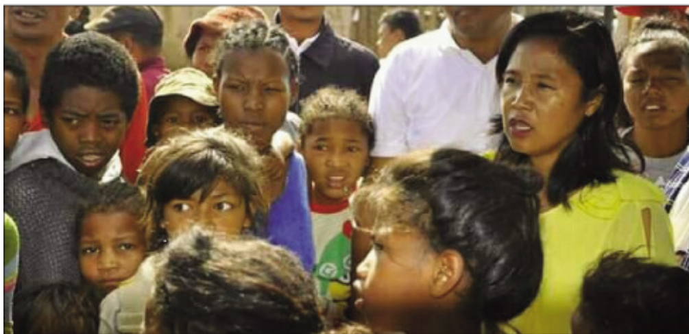
Ny fivoriana fanomanana ny fifampiarahabana tratry ny taona ny TIM.K25 boriborintany faha 6