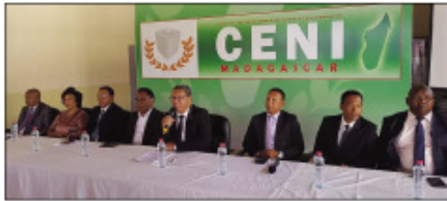
Ireo lohandohan'ny mpisorona ao amin'ny CENI.