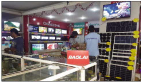
Ireo entana maro samy hafa ao amin'ny Baolai.