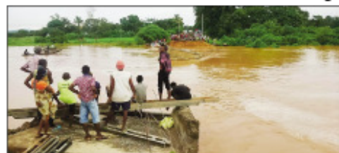
Ilay tetezana tapaka ao Ambilobe.