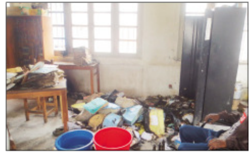
Ireo antontan-taratasy may tao amin'ny biraon'ny tsena Anosibe.

Ny alin'ny alahady 06 janoary 2019 teo tokony tamin'ny 12 ora alina dia nitrangana hain-trano tao amin'ny tsena Anosibe. Tamin'ity indray mitoraka ity dia ny biraon'ny tsena no nisy nikasa handoro, soa ihany fa nisy ireo olona nifanampy namono ny afo teo an-toerana, ka vetivety dia voafehy ny afo. Raha ny hita maso teny an-toerana dia ireo antontan-taratasy mirakitra ny momba ny tsena rehetra sy taratasy hafa no may tamin'izany miampy ireo varavarankely sy ny fitaovana samy hafa. Araka ny tomba-maso hita dia fanahy iniana natao ity