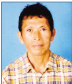
Liva avy amin'ny KMFB.

Anisan'ny firenena nitondra faisana sy nandrain-giraingy, ary niaina tao anatin'ny fahantrana lalina dia lalina nandritra ny taona maro ny firenena malagasy sy ny vahoakany hoy i Liva avy amin'ny KMFB (Komity Miaro ny Fiainam-Bahoaka), noho ny herin'ny maizina avy any Ivelany, izay nandidy sy nibaiko, ka nitondra ankolaka ity firenena malalantsika ity hatrizay. Raha ny tantaran'ireo mpitondra filoham-panjakana nifandimby teto Madagasikara no jerena, dia fantantsika tsara fa efa samy mpikambana tao anatin'ilay fikambanana maizina malaza erantany antsoina hoe : « Franc-maçon » avokoa ny ankamaroan'izy ireo. Amam-polo taonany maro no efa niasa sy no nina teto io fikambanana satanika io. Efa maro noho izany ny olony eto. Rehefa rafi-panjakana mijoro, dia misy ny olony