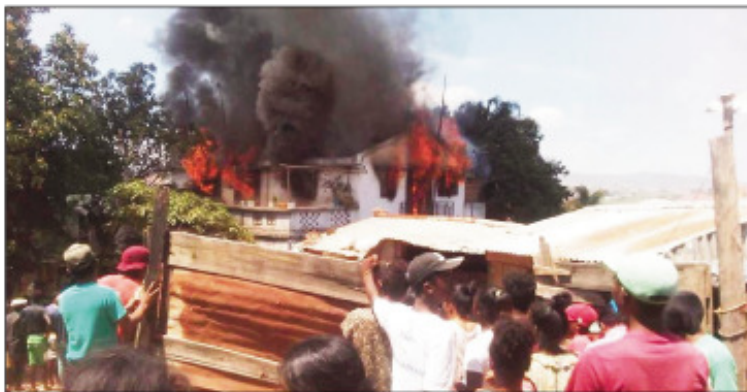
Ilay trano nirehitra teny Ampitatafika.

Nisesisesy ny fahamainana trano tato ho ato teto Antananarivo sy ny manodidina. Omaly, nahitana trano lehibe nirehitra koa teny Ampitatafika distrikan'Antananarivo Atsimondrano. Somary nananosarotra ny famonoana ny afo satria tsy mbola manana itony fiara mpamonjy voina itony ny kaominina eny an-toerana. Samy niezaka nanampy ny tompon-trano tamin'ny famonoana ny afo kosa na izany aza ny manodidina. Bebe ihany ny fahavoazana tamin'ilay tokantrano tratra izao firehetana izao, satria saika