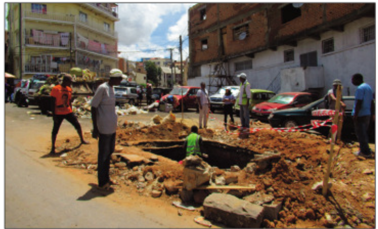
Ny fanamboarana rarivato ny sisin-dàlana tetsy amin'ny EPP Antsahabe, Boriborintany faha-2.