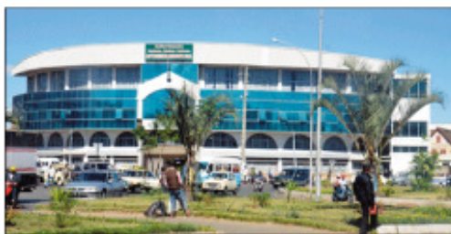
Ny lapan'ny Antanimierandoholona etsy Anosikely.

Raha ny lojikan'ny fiforanan'ny andrimpanjakana hisy manaraka eto dia hijoro ny Governemanta, hotendrena ny Praminisitra, manaraka avy eo ny fifidianana isan-karazany toy ny Antanimieram-pirenena, ny Rezi-naly, ny Distrika ary ny Kaominialy. Fa ny tena goavana amin'ireny dia ho foanan'i Andry Rajoelina ny Antanimierandoholona, izany hoe tsy hanana Senatera intsony i Madagasikara mandritra ny 5 taona itondran'ny. Anisan'ny Velirano nolazainy izany nandritra ny "fihanan'ny kandida 2" tamin'ny fahitalavitra TVM sy ny Radio Madagasikara (RNM), mialohan'ny fifidianana fihodinana faharoa. Koa dia mampamangy indray ary aloha ny Senatera sady mametra-beloma dieny izao. Angoron'ny entana sao voaroka amin'ny tsy fidiny eo raha mbola mihevitra ny hibodo toerana. Nambara mantsy tamin'io fotoana io fa andrimpanjakana mandany vola fotsiny ianareo : "Budge-