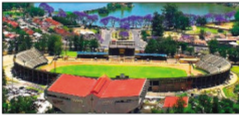
Ny kianjaban'i Mahamasina, hanaovana ny fianianan'ny filoha Andry Rajoelina anio.

Fianianana ataon'i Andry Rajoelina anio eny Mahamasina, misy tsy milamina ny resaka fanasana mahakasika izany. 48 ora mialohan'ny hanatantehana ny lanonana arapitsarana manetriketrika handraisan'ny Fitsarana avo momba ny Lalamparenena (HCC) ny fianianan'ny filoham-pirenena vaovao, Andry Rajoelina etsy Mahamasina, dia miakatra ny feo fa betsaka ireo tsy nahazo fanasana amin'izany, eny fa na ireo mpikambana amin'ny andrimpanjakana sy olomboafidy aza. Voakasik'izany ireo andrimpanjakana andrin'ny demokrasia sy ny fampihavanam-pirenena dia ny CENI, CNIDH, HCDDDED ary ny CFM. Hatramin'ny fotoana nanoratana dia ampahany amin'ny mpikambana amin'ireny andrimpanjakana ireny no