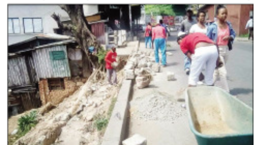
Ny fanamboarana sisindalana nataon'ny CUA tetsy Antsahabe.