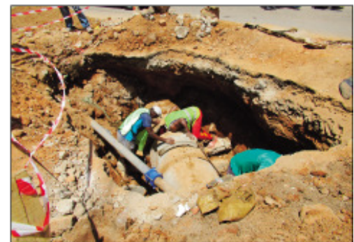
Ny fanamboarana lalana sy fantsona any ambanin'ny tany etsy Antanimena.

Anisan'ny antony iray manimba ny lalana eto Antananarivo Renivohitra ny fahasimban'ireo "buse", na fantson-drano maloto any ambanin'ny arabe, toy izany indrindra no nitranga teny Ankadifotsy ampitan'ny Sekoly Katolika Fo masin'i Jesoa Antanimena; simba noho ny fahantany ny fahatapan'ireo "tuyau"-ny Jirama maritsy ny "buse" iray tao ambanin'ny arabe, ka izay no nahatonga ny fahasimban'ity lalana ity. Ny andron'ny omaly dia tonga avy hatrany teny an-toerana ireo sampan-draharaha misahana ny foto-drafitrasa avy ao amin'ny Kaominina Antananarivo Renivohitra (CUA), mba hamerina amin'ny laoniny indray