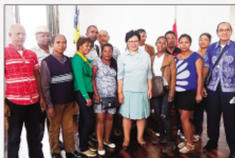
Foto-drafitrasa 3 no haorina amin'ny famatsiam- bola avy amin'ny CUA