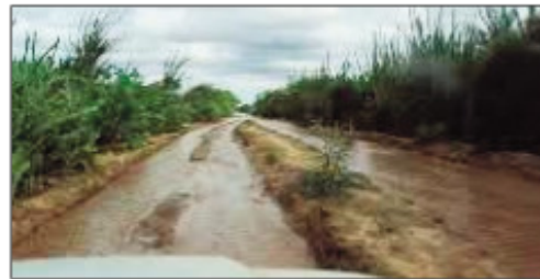
Ny RN 13 feno rano.

Potika ny lalampirenena faha-13 na ny RN13 vokatry ny rotsak'orana be tato ho ato. Dibo-drano avokoa izay rehetra lalovan'ny RN13: Ambovombe- Betroka. Lalana 59 km, roa andro vao afaka. Tsy mampino kaneffa izay no zava-misy. Izany dia noho ny orana tsy nijanona mihitsy tao anatin'ny andro maromaro izao. Vokany, potika avokoa ny lalana, dibodrano avokoa ireo izay lazany maso, simba ny voly sy ny