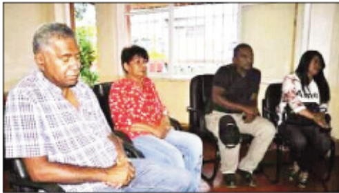
Ny fifampiarahabana tratra ny Asaramanitra tany Antsirabe.