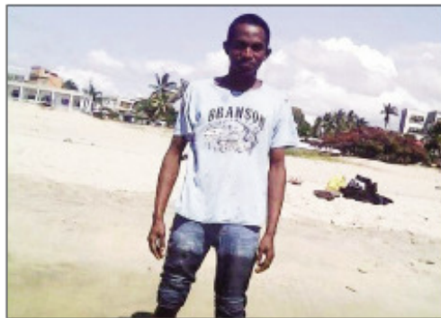
Ilay tovolahy tsy hita niaraka tamin'ny Sprinter nentiny.