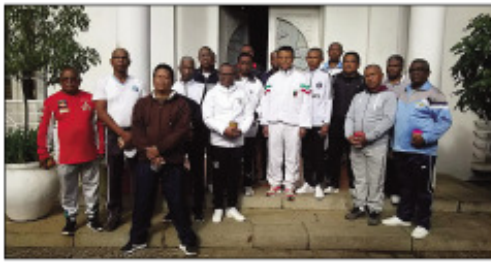
Ny andron'ny manamboninahitra teny Faravohitra.

Nankalaza ny andron'ny manamboninahitra, ny sabotsy 12 janoary teo, ny filoha Ravalomanana sy ireo manamboninahitra niara-niasa taminy teo aloha, teny amin'ny trano fonenany teny Faravohitra. Tamin'izany ihany koa no niarahaban'ireto manamboninahitra ireto ny filoha Marc Ravalomanana sy ny ankohonany, tratry ny taona vaovao 2019. Noho izay andron'ny manamboninahitra sy ny Asaramanitra izay, sady fanao