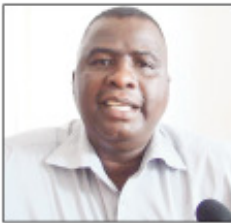
Ny ben'ny tanànan'Ankavandra, manolotra soson-kevitra, ho famahana ny olam-pirahamonina any amin'ny distrikan'i Miandrivazo iny.

E fa tsy asan-dahalo intsony no mifananga ao amin'ny kaominina roa dia Betsipolotra sy Ankavandra, izay samy ao anatin'ny Distrikan'i Miandrivazo ankehitriny. Fifanahana noho ny disadisam-pirahamonina, izay nitranga efa an-taonany maro ary mbola mitohy amin'izao fotoana no misy any an-toerana. Tanàna maro no mifanahana, mifamono ary mifandraiva fananana, misy ihany koa fanafarana mpikarama an'ady avy any ivelan'ny faritra mi-hitsy entina hanampy to-sika ny mpiady ao antanàna. Mizaka ny vokatra ny ady ny zaza amam-behivavy ary mitsoaka any an'ala. Tanàna roa antsoina hoe Ankilimanarivo sy ny ao Ampoza Betsipolotra no niantombohan'ny ady, famonoana mpandrahaha sy fahaverezana basy natoon'andian-dahalo, izay noheverin'ny ankilany ao Ankilimanarivo ho voakarama. Io fimaliana io no mbola