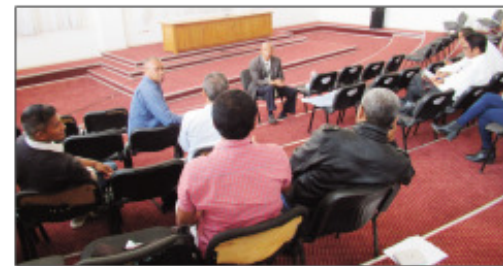
Fivoriana momba ny mety ho fiantraikan'ny loza voajanahary, tao amin'ny Lapan'ny tanàna Analakely.