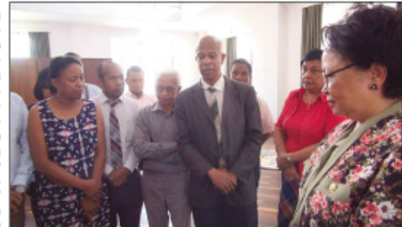
Ny fiarahabana ny ben'ny tanàna tao amin'ny Lapan'ny Tanàna Analakely.