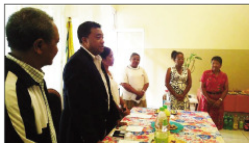
Ny fifampiarahabana tratry ny taona tao amin'ny Boriboritany faha-3.

Amin'izao tonontaona izao dia tonga niarahaba nahatratra ny taona 2019, an'ireo mpitantana tao amin'ny Boriboritany fahatelo, kaominina Antananarivo Renivohitra (CUA) ny faran'ny herinandro teo, ireo sekretera sy mpitam-bola avy ao amin'ny fokontany miisa 34 manerana ny boriboritany fahatelo. Izany dia notontosaina tao amin'ny birao Antaninandro. Marihana fa efa fanaon'izy ireo isan-taona izao hetsika izao,