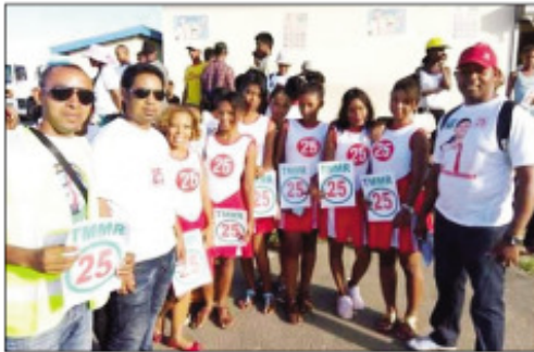
Ny sasany amin'ireo mpikambana TMMR.

Tao aorian'ny fanambarana ny vokatra ofisialin'ny fidianana nataon'ny HCC, Fitarana Avo momba ny Lalampantrenana, misy ny fanambarana avy amin'ny Tmmr (Tanora Manohana an'i Marc Ravalomanana), mahakasika ny toerana misy azy ankehitriny. Manoloana ny kihon-dalana izay lalovan'ny firenena toy ny misy ankehitriny hoy ny fanambarana dia maro amin'ny olona no mameotra-panontaniana hoe aiza ho aiza ny toerana misy ny TMMR, koa aoka ary hazava hoy izy ireo fa : -Ny TMMR dia tsy miova anarana fa mijanona amin'izay anarana efa nahazatra hatramin'izay dia ny hoe "Tanora Manohana an'i Marc Ravalomanana". -Ny TMMR dia tsy miala amin'ny tanjona efa nape-traka hatrizay dia ny Fanohanana ny Filoha Ravalomanana ary tsy mivadi-belirano aminy. -Ny TMMR dia mbola vonona ny hiatrika ireo fidianana mbola hoavy rehetra eo ary vonona