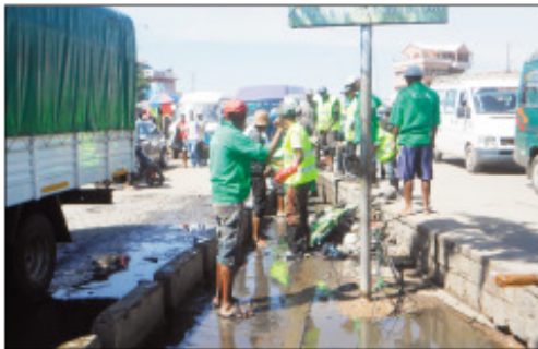
Ny asa fanadiovana tao aorian'ny orana teny Anosibe.

Ny alakamisy teo ny teo anivon'ny kaominina Antananarivo Renivohitra (CUA), Boriboritany faha-4 dia nanatanteraka fanadiovana faobe teny amin'ny faritra Anosibe, nianga teny amin'ny rond-point tsehan'Anosibe hatreny amin'ny Pharmacie Volahanta izany. Niarahana tamin'ny Direction des travaux publique (DTP) ny Equipements Specialises en Assainissement (ESA), sy ny ekipa Teknika eo anivon'ny Boriboritany faheafatra ary ny SAMVA. Ny hetsika dia niompana tanteraka tamin'ny fanalana ireo tsentsina rehe-