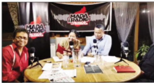
Ny ady hevitra teo amin'ny 25 sy ny 13 tany Paris.