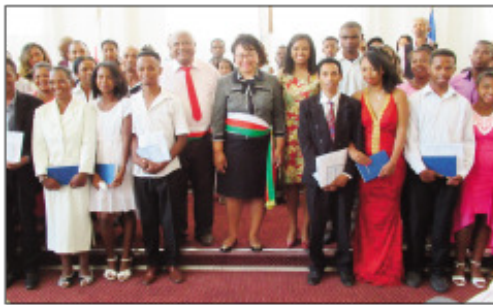
Ny fisoratam-panambadiana faobe tao amin'ny Lapan'ny Tanana Analakely.

Nahazo tombony manokana ny alakamisy teo ireo mpivady 45 satria dia ny Ben'ny Tananan'Antananarivo Renivohitra Lalao Ravalomanana mihitsy no tonga nampitambatra azy ireo tamin'ny alalan'ny Fisoratam-panambadiana faobe, tao amin'ny Lapan'ny Tanana Analakely. Araka ny namban'ny Ben'ny Tanana dia anisan'ny fitaizana ny vahoaka mba hanana tokantrano vanona sy modely ho reharehan'ny fianakaviana ny fisoratam-panambadiana, ka fifaliana ho azy no natanteraka izany tamin'io