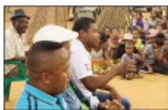
Ny tohin'ny fampielezan-kevitra tany Ilakaka.

Fampielezan-kevitra amin'ny fihidianana ny 19 desambra ho avy izao, manohy ny fanentanana fampandaniana an'i Dada N°25 ny K25 any Ilakaka distrikan'ihosy faritra Ihorombe, tarihan'ny mpanao gazety Fernand Cello. Nasongadin'izy ireo tamin'izany fa mpanangana fa tsy mpan-drava isika, miombona mba hitovy hevitra. Ny alakamisy teo, natomboka tao amin'ny Carreau N° 05 "Fokontany Manombobe ny fandresen-dahatra, ary avy hatrany dia nanangana