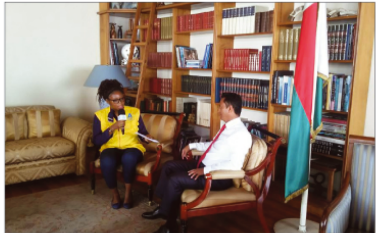
Nizara fanomezana ho an'ireo mpiasa ny Boriborintany faha-5