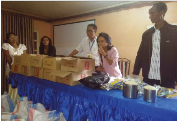
Ny fizarana fanomezana tao amin'ny Boriboritany faha-5.