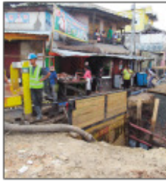
Fantsona apetraka eny amin'ny Aigle Noir Ambodin'Isotry, ka tsy maintsy hanisahana ireo mpivarotra.

M ba hahafahana manatanteraka am-pilaminana ny tetik'asa PIAA (Projet d'Intervention d'Assainissement d'Antananarivo) dia tonga teny amin'ny Aigle Noir Ambodin' Isotry, Boriboritany voalohany omy, ireo mpiasan'ny Kaominina Antananarivo Renivohitra (CUA), hanisaka sy hamindra ny toeran'ireo mpivarotra izay manamorona ny toerana. Tsa-ra ny manamarika fa ity tetik'asa ity dia tetik'asa fanadihovana an'Antananarivo mba ho fisorohana ny tondra-drano matehaka eny amin'ireo faritra iva, hisy araka izany ny fametra-