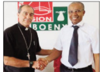
Ny filhaonana teo amin'ny lehiben'ny faritra Boeny sy ny Evekan'i Mahajanga mpisolo toerana.