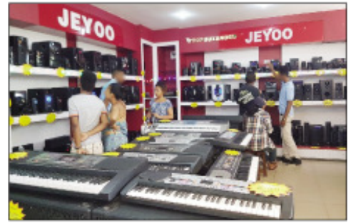
Ireo entana maro samy hafa amin'ny Tranombarotra Baolai.