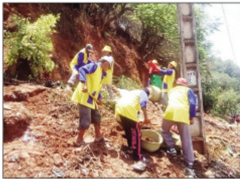
Tany ahiana hihotsaka teny Ankatso.

Miatrika ny fahatongavan'ny fahavaratra ny Boriboritany faha-2, Kaominina Antananarivo Renivohitra (CUA), Nesorina avokoa ireo tany mitady hihotsaka teny Ankatso ny andron'ny talata mba ho fisorohana ny mety ho fihotsahana ka hampidi-doza. Taorian'ny fitirihana izay nataon'ny ekipa Teknika sy ny fitarainan'ny mponina manodidina no nahafahan'izao ireo nanatanteraka izao asa izao. Amin'izao fotoam-pahavaratra izao dia ahiana ny mety hisian'ny tany mihotsaka eny amin'ny faritra sasany eto an-dRenivohitra, ka izay indrindra no