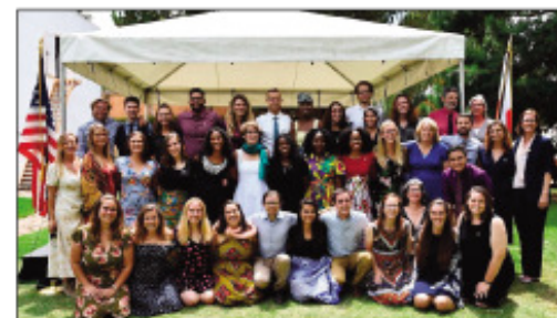
Ireo mpilatsa an-tsitrapo Amerikana hiasa eto amintsika.