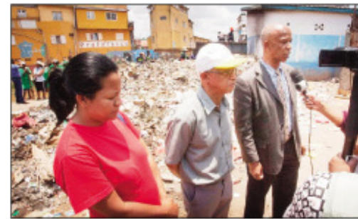
Ireo mpiara-miasa amin'ny ben'ny tanàna, teny Andohatapenaka.

Taorian'ny fidanana ifotony nataon'ny ben'ny tanàna Lalao Ravalomanana ny alatsinainy 19 novambra lasa teo, nijery ireo fako misavovona teny Alarobia, Vasakaosy tsenan'ny Atody, Anosivavaka ary Ankadifotsy, dia tsy niandry ela ny fiadidiana ny tanànan'Antananarivo fa avy hatrany dia nanamafy ny fanamafiana ny SAMVA amin'ny fandraofana ny fako, na tsy andraikiny aza izany. Ny zava-dehibe araka ny toromariky ny ben'ny tanàna Lalao Ravalomanana dia tsy azo atao sorona ny vahoakan'Antananarivo sy ny tanàna amin'ny maha soa iombonan'ny Malagasy azy. Araka izany, nanomboka ny alakamisy 22 oktobra dia amafisina ny fanadiavana ny tanàna amin'ny fanomezan'ny kaomina nina sy ny malala tanana firabe amam-polony hampiasain'ny SAMVA handraofana ny fako. Manome toky ny ao anivon'ny tanànan'Antana-