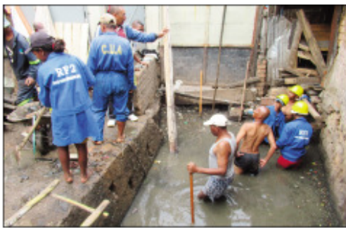
Fanadiovana nataon'ny CUA tao amin'ny Boriboritany I.

Ho fitsinjovana ireo vahoaka madinika izay mipetraka eny amin'ireo faritra iva eto an-dRenivohitra dia tonga nanamafy ny asa fanadiovana ireo lakandrano, izay tsentsin'ny fako sy fotaka, ireo rantsamangaika maro avy eo anivon'ny Kaominina Antananarivo Renivohitra omaly, ho fisorohana ny fiakaran'ny rano. Teny Ambodin'Isotry sy teny Antetezana Afovoany II, no nanantantehana ny asa tamin'io omaly io. Tsy mijanona hatreo izany asa goavana izany fa mbola hitohy eny amin'ireo faritra hafa. Ankoatra izay dia nanadio lalana sy nanisaka ireo mpivarotra